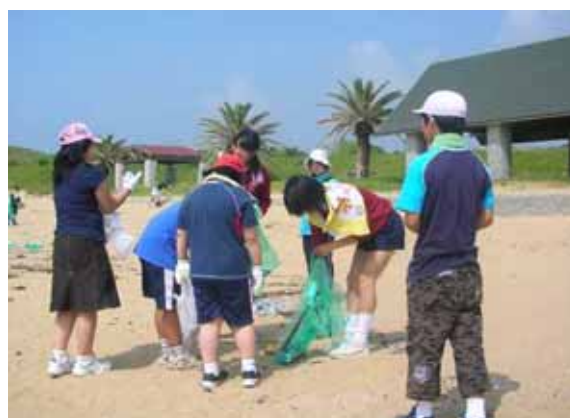
小中高合同海岸清掃