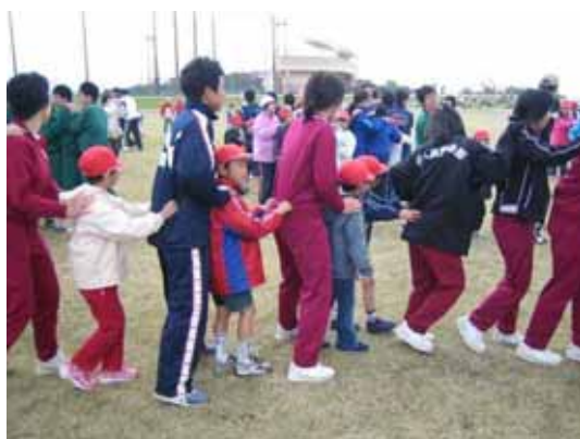
小中高合同歓迎遠足