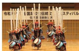
全国高校生伝統文化 フェスティバル