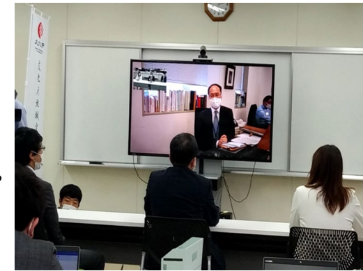
テレビ会議システムでの打合せの様子