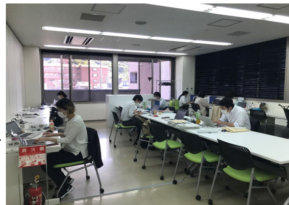
写真：移転シミュレーションにおける京都での執務の様子