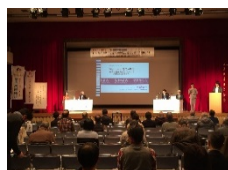
歴史文化遺産フォーラム