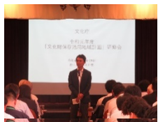
文化財保存活用地域 計画等連絡協議会