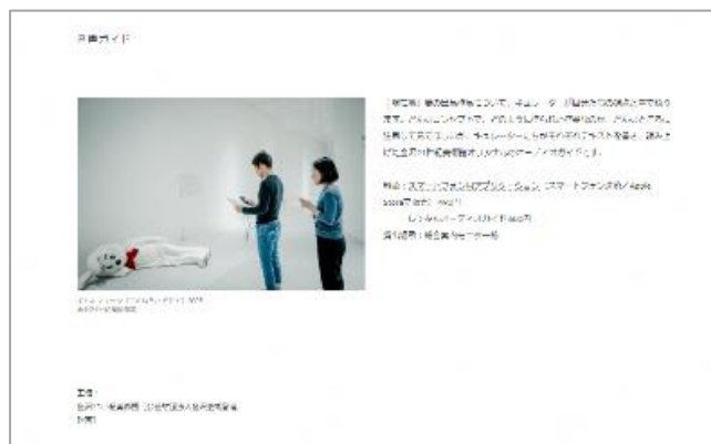
オリジナルオーディオガイド