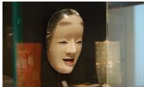
金沢能楽美術館 2F 展示室