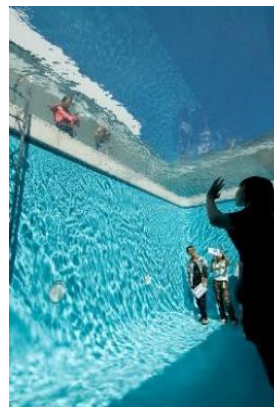
レアンドロ・エルリッヒ《スイミング・プール》2004年