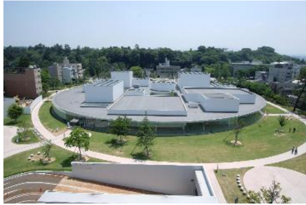
金沢 21 世紀美術館 外観