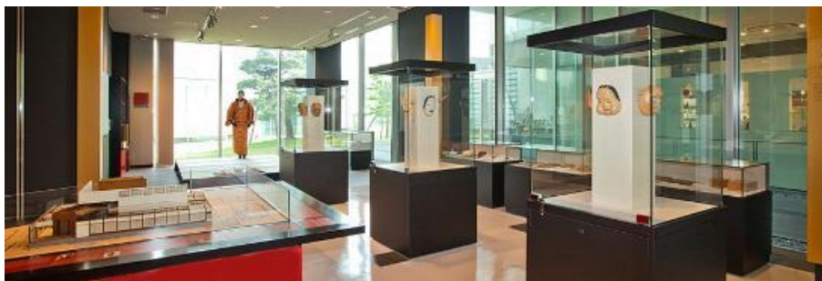
金沢能楽美術館 1F 導入展示