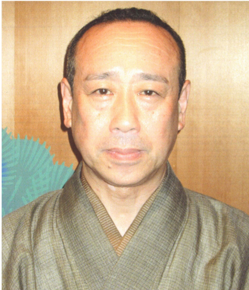
ほうしょう 寶生 きんや 欣哉 氏 （寶生 欣哉 氏）

「 のう 能 かた ワキ方」は、平成6年6月27日に重要無形文化財に指定されたが、平成28年2月1日、保持者の逝去により指定が解除された。今回、改めて指定するとともに、寶生氏をその保持者として認定するものである。