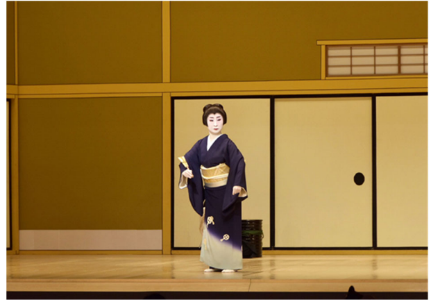
( きょうまい 京舞 ぎだゆうぶし 義太夫節 おぐりきよくばものがたり 「小栗曲馬物語」)