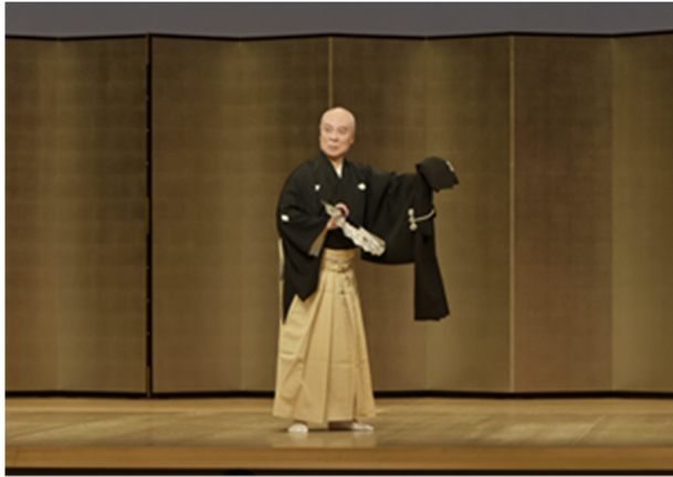
(歌舞伎舞踊 (素踊り) ときわずぶし 常磐津節 かげきよ 「景清」)

今回認定する56名は、 にほんぶよう 日本舞踊の技法を高度に体现し、重要無形文化財「 にほんぶよう 日本舞踊」の保持者としてふさわしい者であるので、重要無形文化財「日本舞踊」の保持者の団体の構成員（ にほんぶようほぞんかいかいいん 日本舞踊保存会会員）として認定するものである。