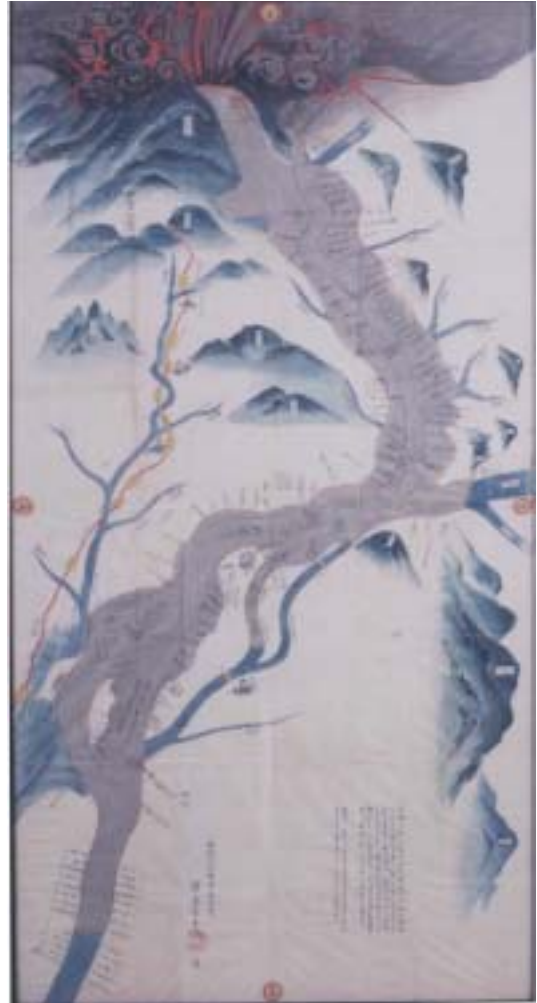
■「浅間焼吾妻川利根川泥押絵図」：当時の人が描いた天明泥流のもよう

根岸の記述にあるように、当時の村においては、格式や挨拶の仕方などにおいて厳しい身分格差が存在したが、被災直後には、近隣の有力百姓が中心となって、それまでの家格にこだわらず、鎌原村の生存者全員に親族の約束をさせ、そのうえで妻を亡くした夫と夫を亡くした妻とを再婚させたり、親を亡くした子を子を亡くした老人の養子にし