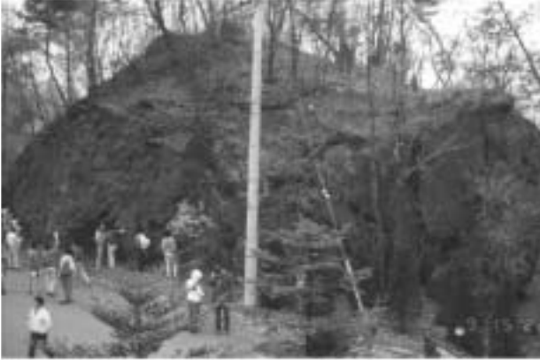
■鎌原火砕流／岩屑なだれに含まれていた巨大な岩塊