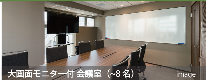
大画面モニター付会議室 (~8名)