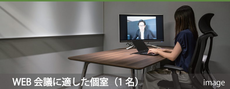
WEB会議に適した個室 (1名)