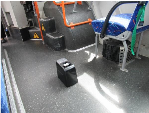
車両用クレベリン作業の様子 (バス)