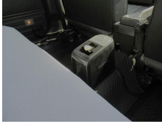
車両用クレベリン作業の様子 (タクシー)