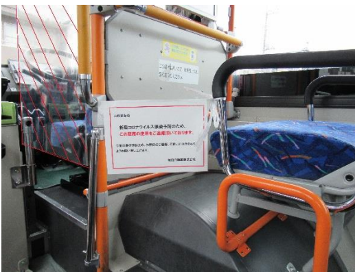
座席利用抑制とビニールカーテン (カーテンは赤縞模様の箇所)