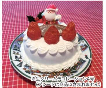
※生クリームデコレーション4号(フレードは商品に含まれません)

ケーキ屋 ROBOT ロボット 旬の素材をふんだんに使ったケーキ屋さん。ファミリーから二人きりのクリスマスにも選んで頂けるよう、多数取り揃えております。詳しくはブログをご覧ください。 http://blogs.yahoo.co.jp/ginnanoyaji28go ケーキの引換日: 12月23・24・25日 ケーキの予約締切日: 12月20日 ●住所/上尾市柏座1-10-3-70 ●TEL/772-3552 ●営業時間/10:00~20:00 10:00~19:00(祝祭日) ●定休日/日曜日(12月11日以降年内休まず営業)