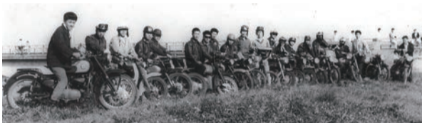
▲SMCCの貴重な集合写真