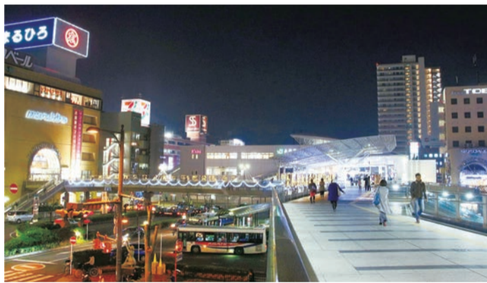
▲足かけ4年の歳月をかけて、より快適で、より安全な空間へと発展した上尾駅。その変遷を振り返ると、イルミネーションの輝きが一層まぶしく感じられます