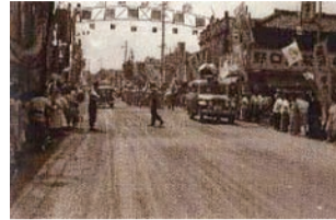
▲1958年(昭和33年)7月15日に駅周辺の中山道で開催された市制施行の祝賀パレード(写真左)と、当時の東口駅前通りの様子(写真提供/上尾市広報広聴課)