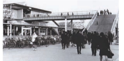
▲1969年(昭和44年)6月、上尾駅改札口(写真上)と西口駅前の風景。橋上駅が完成し、自由通路で駅の東西が結ばれて利便性も飛躍的に向上しました(写真提供/上尾市広報広聴課)

■資料引用/上尾市WEBサイト ●あげお写真館 ●[広報あげお]2011年3月号 ●[広報あげお]2013年7月号