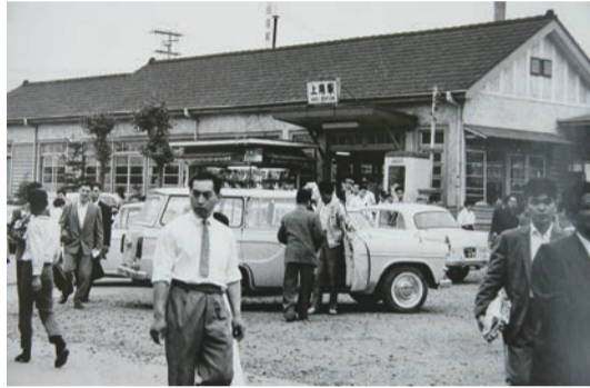
▲1963年(昭和38年)7月、上尾駅と東口駅前広場

時代を超えて“あげおの顔”として中心市街地の要となってきた上尾駅。来る2018年、上尾市は市制施行60周年、上尾商工会議所は創立50周年を迎えます。