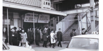
▲1969年(昭和44年)2月、橋上駅改築工事の中の上尾駅東口