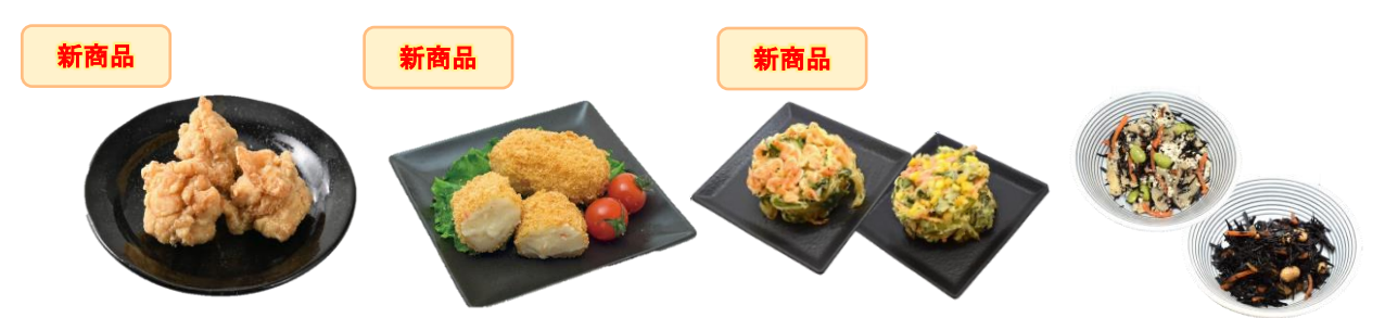
レモン香る!鶏もも竜田揚げ 紅ズワイガニクリームコロッケ 旬の素材を使ったかき揚げ 80キロカロリー以下の和惣菜

また健康志向にお応えする総菜として、大豆ミートを使用したメンチカツをはじめ、健康を 意識したコロッケ、80キロカロリー以下の「五目ひじきの煮物」「国産豆腐とひじきの炒め煮」 などの和惣菜を展開します。