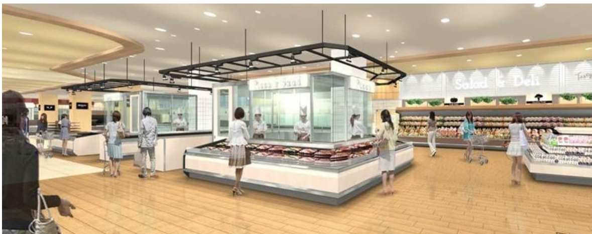
「ライブキッチン」イメージ

「米飯」…イトーヨーカドー自慢の素材とシャリにこだわった“握り寿司”“ちらし寿司”を中心に、季節に応じた県内産の素材を用いた新メニュー・商品を日々ご提案いたします。