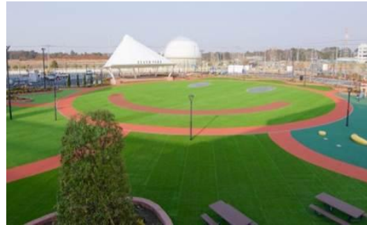
「スマイル・パーク」全景

自然空間とイベントスペースを兼ね備えた約4,000坪の超大型パークに、約3,000人規模の野外コンサートができる屋根付きステージを設置しました。手軽に美味しいフードバスが並ぶエリアも併設し、ご家族やご友人同士で楽しめる大規模なフェスやイベントを随時開催していく予定です。さらには、バーベキューゾーンも隣接、「遊べる」空間を創りだしました。