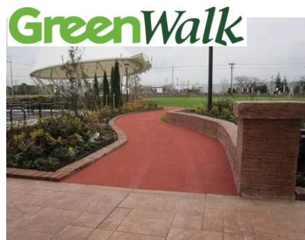
「グリーン・ウォーク」イメージ

また、「スマイル・パーク」を起点とした約800mのウォーキングロード「グリーン・ウォーク」では、季節ごとに表情を変える樹々や草花と触れ合いながら、すがすがしい気持ちでジョギングや散歩を楽しんでいただけます。桜等、四季を感じていただける樹木・植物を植える等、ベンチでお休みいただける休憩スペース「さくらデッキ」も用意し、地域のお客様に健康と癒しをご提供いたします。