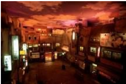
新横浜ラーメン博物館