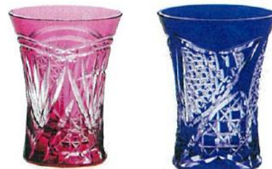
商品の一例 イメージ