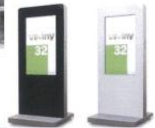
オムニチャネルカウンターおよびデジタルサイネージ イメージ