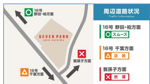
「道路状況サイネージ」イメージ

館内にいながら、周辺道路の交通状況が確認いただける「デジタルサイネージ」をご用意。見やすい周辺MAPとライブカメラで一目でわかりやすい表示にてご確認いただけます。お帰り時の渋滞のストレスを無くし、充実したショッピングをお楽しみいただけます。館内から駐車場に向かう出入りに計16台設置いたしました。