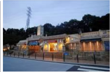
寄居 星の王子さまPA