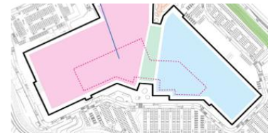
「レストラン&フードコート」

「ウエスト・ウイング」、「イースト・ウイング」にまたがる3F中央部には、計25店、2,000席を有する地域最大級となる「レストラン&フードコート」を展開いたします。日本初、千葉県初となる15店も出店し、ゆったりとした空間で、こだわりの素材・メニューをご提供してまいります。