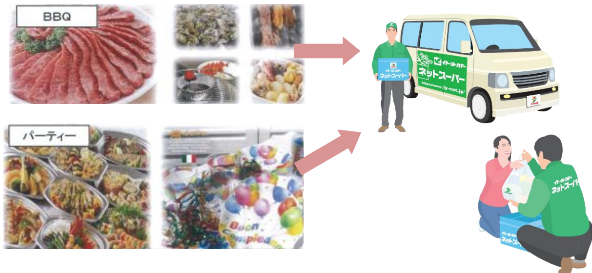
ご利用シーンに応じたご注文 イメージ

イトーヨーカドーネットスーパーでは、「バーベキュー」や「ホームパーティー」等、お客様のご利用シーンに応じて、1F 食品売場で販売するバーベキューセットや、ライブキッチンでご提案する惣菜メニュー等を、ネットスーパーでもお気軽にお買い物のできるようにいたします。また、目的に応じた関連商品がまとめて見られる工夫も凝らし、バーベキューやパーティに必要な、食品以外の消耗品やレジャー用品等の日用品もご注文いただけるよう、さらに便利なサービスに取り組んでまいります。