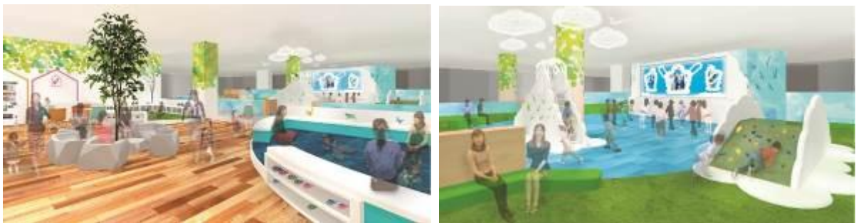
「スカイ・キッズ」イメージ

さらには、ベビーカーをきちんと置いておけるスペースなども設置。同世代のお子様を持つご家族同士の新たなコミュニケーションが生まれ、お互いの情報交換やお子様同士が仲良くなれるような環境をご用意します。