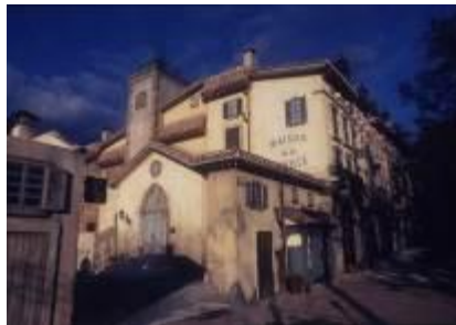
箱根★サン=テグジュペリ星の王子さまミュージアム