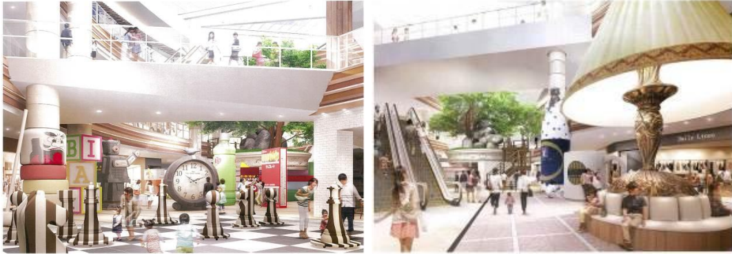
「ビッグ・ワンダー」イメージ

巨大なチェスや時計等、実際に動くオブジェもあり、まるで自分が小人になったかのような空間をお楽しみいただけます。ご自身で記念撮影をして情報発信もでき、オブジェを見ながら、楽しみながらくつろげる、体験型・発信型のレストスペースをご提供いたします。