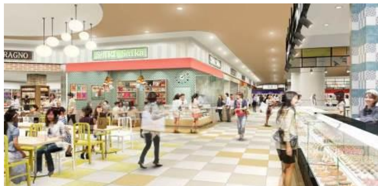
「フード・バザール」イメージ

また、お客様がご自宅にお持ち帰りいただくだけでなく、その場でも食べていただけるよう店舗や共用スペースのイートインも充実させました。ご自宅でも、お店でも、施設内の公園「スマイル・パーク」等、お出かけ先でも美味しく食べていただける便利な商品を揃え、イトーヨーカドー食品売場を中心に、地域 No.1 の食品エリアを目指します。