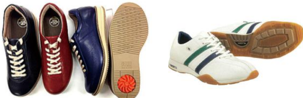
商品の一例 イメージ