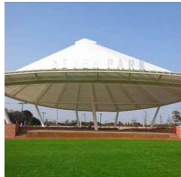
「スマイル・パーク」のステージおよび遊具一例

また、「スマイル・パーク」を起点とした約800mのウォーキングロード「グリーン・ウォーク」では、季節ごとに表情を変える樹々や草花と触れ合いながら、すがすがしい気持ちでジョギングや散歩を楽しんでいただけます。桜等、四季を感じていただける樹木・植物を植える等、ベンチでお休みいただける休憩スペース「さくらデッキ」も用意し、地域のお客様に健康と癒しをご提供いたします。