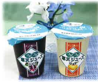
つぶつぶの寒天が入った寒天ジュース。 クールスカイ(ゆず味・ぶどう味)