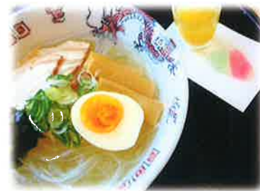
山岡細寒天が麺の「寒天らーめん」 低カロリーで満腹感も得られる名物らーめん。 寒天らーめん