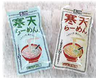
低カロリーで手軽に食べられる山岡細寒天が麺の「寒天ラーメン」。 しょうゆ味・とんこつ味