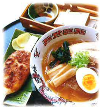
かてんかん人気メニューのセット。 寒天らーめん・五平餅・ところてん

モーニング コーヒーお飲み物にサービス (8:30~11:00) ※午後からは、お飲み物にミニスイーツがつきます