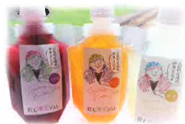
山岡細寒天を使用した低カロリーのスイーツ「飲む寒天ジュレ」。 オレンジ味・ゆず味・ぶどう味