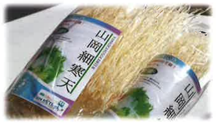
細寒天 細寒天は、4種類からお好みの量をお選びいただけます。