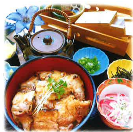
季節ごとに献立が変わるランチ。 華御膳