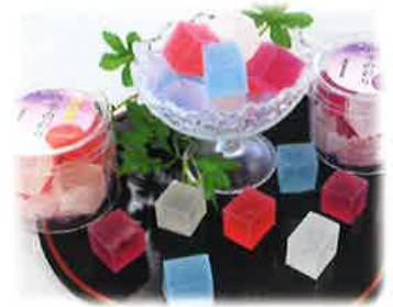
山岡細寒天を使用した不思議な食感が楽しめる手づくりの和菓子。 琥珀糖「凍ての華」