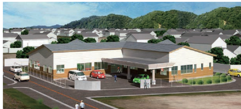
↑美浜町福祉支援センター「あいぱる」(イメージ図)

7月30日から8月15日にかけて募集していた、美浜町福祉支援センターの愛称が、「あいぱる」に決定しました。 この施設は、「子どもたちの発達支援サービス」と「障がい者の生活支援サービス」を提供するもので、今年度の完成に向けて、現在、旧町立図書館跡地に建設を進めています。町では、広く町民の皆さま