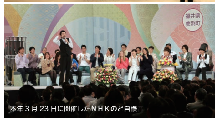
本年3月23日に開催したNHKのど自慢