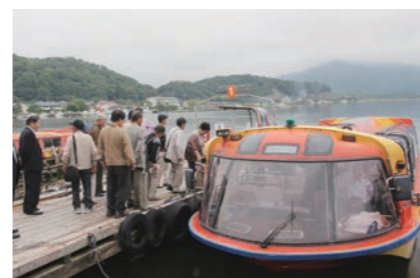
↑三方五湖ジェットクルーズで自然を満喫