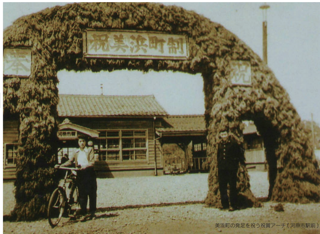
美浜町の発足を祝う祝賀アーチ（河原市駅前）

美浜町が誕生してから今年で60年。 これまでに数々の大きな出来事がありました。 幾多の困難を乗り越え、発展を遂げてきた本町を写した1枚の写真。 今月号では、美浜町が歩んできた60年の軌跡を当時の写真とともに振り返ります。