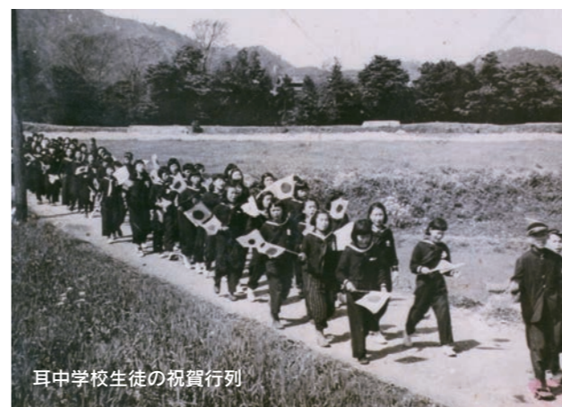
耳中学校生徒の祝賀行列

人口：14,779人 戸数：3,049戸 面積：152.6km 2 産業別の人口：農・山・漁業 9,763人(約66%) 商・工業ほか 5,016人(約34%)