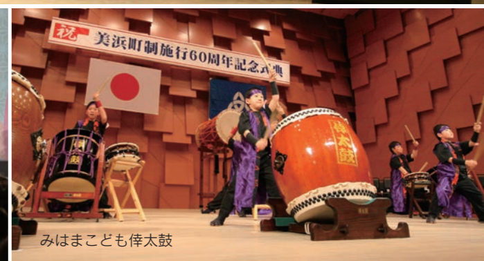
みはまこども侍太鼓