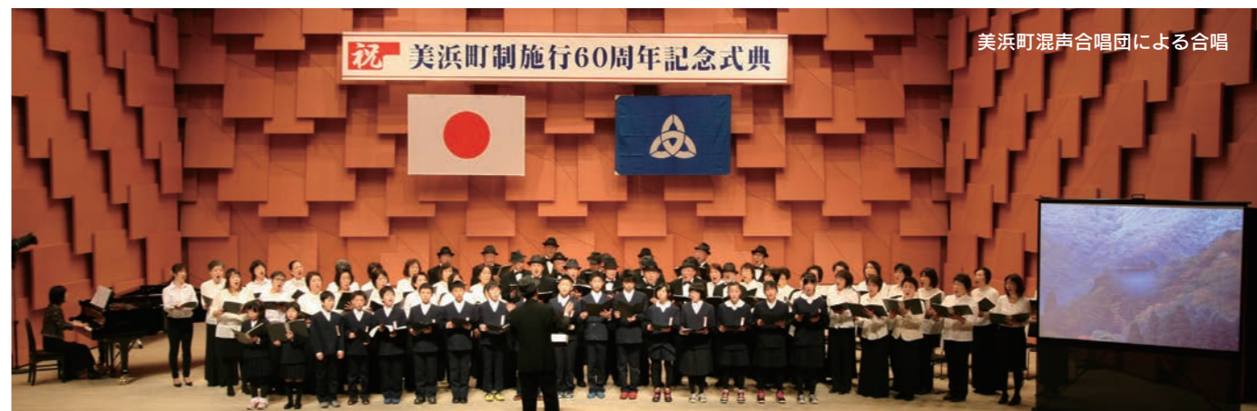
美浜町混声合唱団による合唱

平成26年2月11日に、町制施行60周年記念イベントがなびあすで行われ、町政功労表彰や60周年特別表彰、町民による合唱や太鼓の演奏等が行われた。 記念イベントでは、「NHKのど自慢」や「ふるさと美浜里帰り同窓会」を開催しており、今後も各種記念行事の開催を計画している。