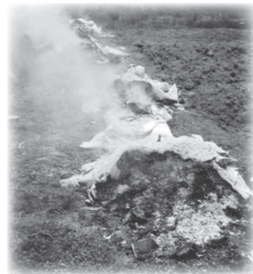
↑環境に悪影響を及ぼす野焼き

野焼きを行うと、300℃程度の低い温度での焼却となり、燃やすものによっては、毒性が非常に強いダイオキシンの発生原因となります。また、住宅地付近で野焼きを行うと、煙が家の中に入ったり洗濯物に煙がついたり、周辺の生活環境にも悪影響を及ぼします。