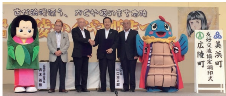
↑手を取り合い発展することを誓い合った広陵町と美浜町

9月20日に、奈良県広陵町の「広陵町かぐや姫まつり」会場において、美浜町と広陵町が友好交流協定を締結しました。 両町は、平成15年に美浜町観光キャラバン隊が広陵町を訪れたことを機に交流を始め、これまで相互の物産展やイベント会場で観光PR活動等を行ってきました。 今回の協定締結は、両町のさらなる発展と、相互の支援活動強化等を目的に行