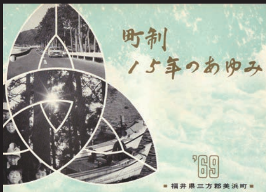
↑昭和44年に発刊した「町制15年のあゆみ」