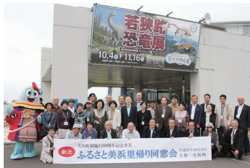
↑若狭路恐竜展 2014 で恐竜の世界を堪能

人が訪れ、なびあすで歓迎式を行った後、若狭国吉城歴史資料館や現在開催中の「若狭路恐竜展2014」等を見学し、三方五湖ジェットクルーズで美浜の自然を体感しました。 参加者は、懐かしい風景に思いを巡らせながら、久しぶりのふるさと美浜を満喫していました。