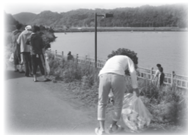
↑久々子湖周辺での清掃活動

三方五湖保全対策協議会では、今後も五湖の環境と景観の保全を目的に、継続して清掃活動を行う予定です。今後とも皆さんのご協力をお願いいたします。