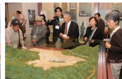
↑若狭国吉城歴史資料館を見学