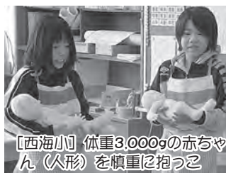
【西海小】体重3,000gの赤ちゃん (人形) を慎重に抱っこ

助産師から「いのち」のはじまりの話の聞いたり、赤ちゃん (人形) を抱っこしたり、ドップラー (赤ちゃん心音計聴診器) で心音を聴いたりしました。いのちの尊さに改めて気づき、自分を含めた周りの人たちを大切に思える心が育ちますように。(昨年度、舞戸小12月2日、西海小3月1日に実施)