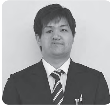
総務課 財産管理班

町民の皆さんが、住みやすくいきいきとした生活を送ることができるよう、行政サービスを提供していきたいです。よろしくお祈りします。