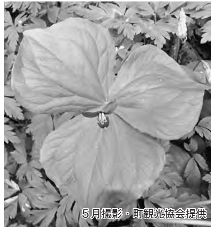
5月撮影・町観光協会提供