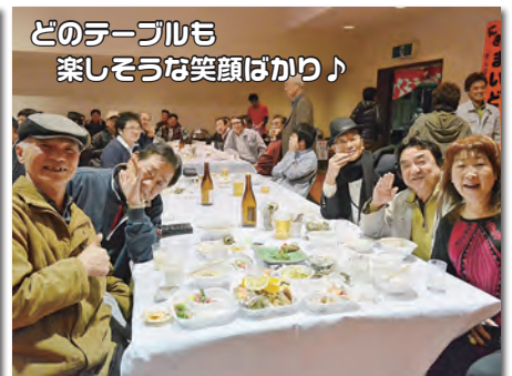
どのテーブルも 楽しそうな笑顔ばかり♪