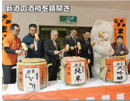
新酒の酒樽を鏡開き