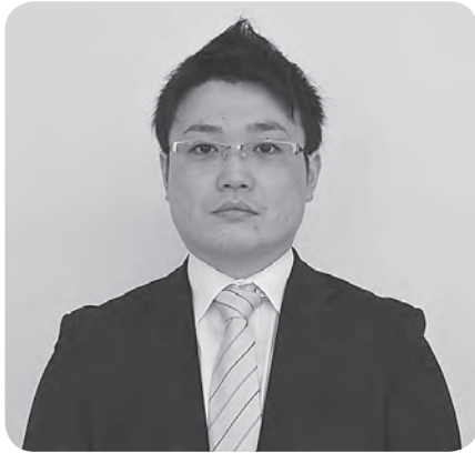
農林水産課 農林班