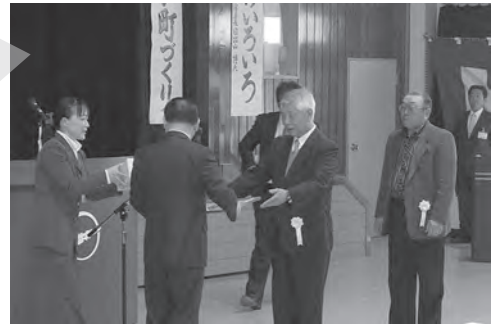
鱈ヶ沢町納税貯蓄組合総会における表彰の様子

町では、住民の納税意識の増進を図り、納税成績の向上に努め、他の模範となる優良納税貯蓄組合及び組合長に対し、表彰を行っています。