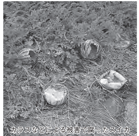
カラスなどによる被害で腐ったスイカ