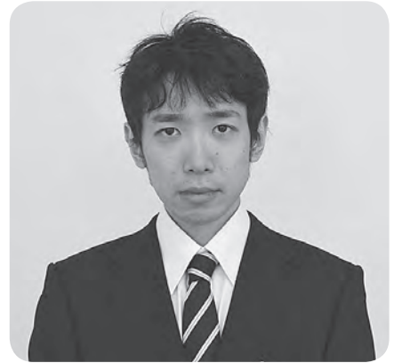
福祉衛生課 子ども家庭班

自分の生まれ育った鱈ヶ沢町をよりよくするため、自分の持てる力で頑張っていきますので、応援お願いします。