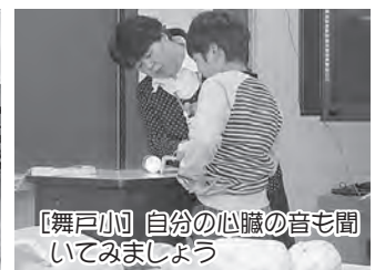
【舞戸小】自分の心臓の音も聞いてみましょう