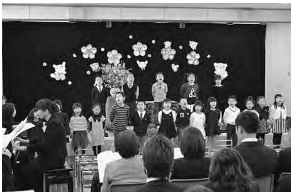
「大好きだったなるさわ保育園を忘れません さようなら ありがとう」涙あふれる閉園式となりました