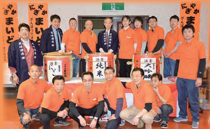
オレンジ色が舞戸商店会青年部のカラー

新酒の会「酒宴」も、今回で15回目を迎えることができました。これも、鯉ヶ沢町をはじめ、町商工会、町観光協会ならびに町民の皆様、多くの方々のご協力によるものと感謝しております。