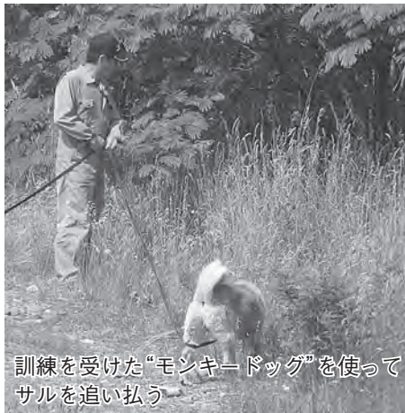
訓練を受けた「モンキー・ドッグ」を使ってサルを追いかける

ものです。現在、猟友会会員は19名と少数であることから、農作物等を有害鳥獣から守る担い手を育成するために助成します。なお、免許取得後は猟友会に入会し、有害鳥獣の捕獲に取り組むことが条件となります。