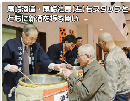
尾崎酒造・尾崎社長(左)もスタッフとともに新酒を振る舞い