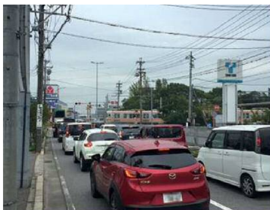
かん うち 勘の内踏切（(国)247号）