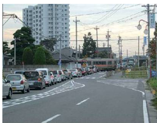
あら こ 荒古踏切（(市)荒古線）