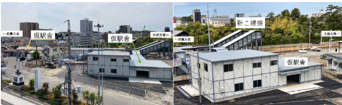
【半田仮駅舎の位置】