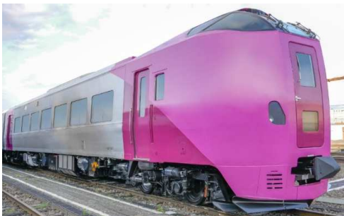
「はまなす」編成外観