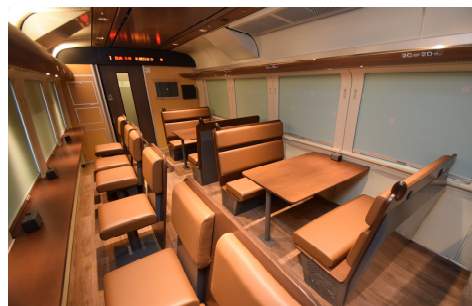
増1号車 「はまなすラウンジ」