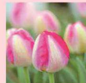
直方市 チューリップ