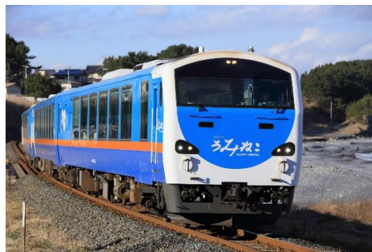
リゾートうみねこイメージ