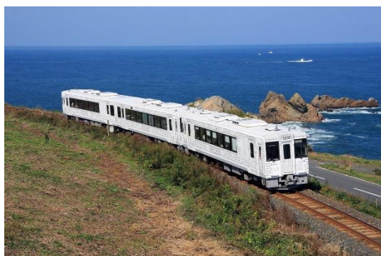
TOHOKU EMOTION イメージ

※指定席のご予約は、パソコン・スマートフォンから簡単・便利にお申込みが出来る「えきねっと」をぜひご利用ください。