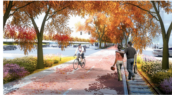
武昌滨江右岸大道枫林尽染效果图