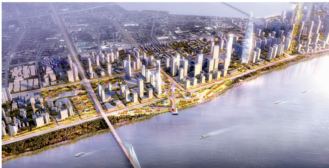
武昌生态文化长廊效果图

武九铁路北环线有很大一部分位于规划中的长江主轴核心区内。在市委市政府的谋划下,武九铁路北环线搬迁及配套设施建设成为长江主轴建设的重要组成部分。作为搬迁配套重点工程之一,地下综合管廊于前期率先启动建设,目前综合管廊示范段已经完成,这也在事实上为长江主轴建设吹响了第一号角。