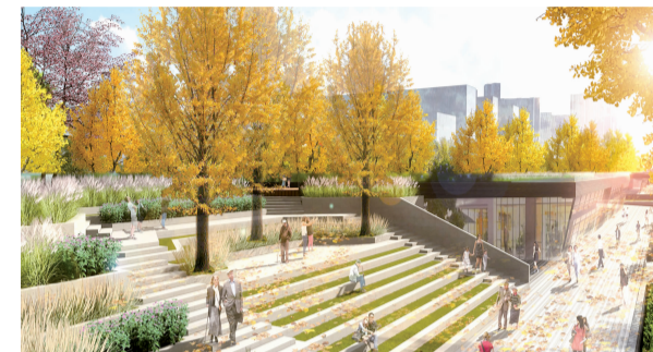
沙湖湖岸廊桥银杏长廊效果图