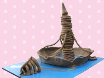
ねんどのひもから「魔法界の王宮」