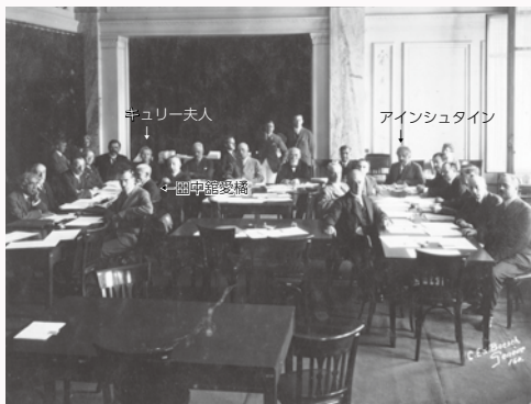
田中館愛橋は国際連盟の知的協力委員会で、同じ委員のアインシュタインやキュリー夫人らとも交流を深める＝1927（昭和2）年

田中館は生涯で68回の国際会議に出席した。海外出張の多くは、62歳になった1918（大正7）年から79歳の32（昭和7）年までの間に集中した。