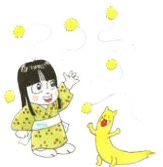
イラスト：きり光乗