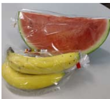
これから食べる機会が増えるスイカ や、給食などにも多く出されるバナ ナなどは皮にも結構な重さがあります

一人ひとりが小さな取り組みを続ける ことで、大きな成果が生まれるはずで す。決して大きな負担ではないと思いま すので、普段の生活から少しずつ、ご みの減量を意識して生活しましょう。