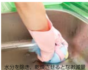
水分を除き、乾燥させるとなお減量