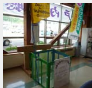
回収場所①旧学校給食センター（堀野）（左）②浄法寺総合支所