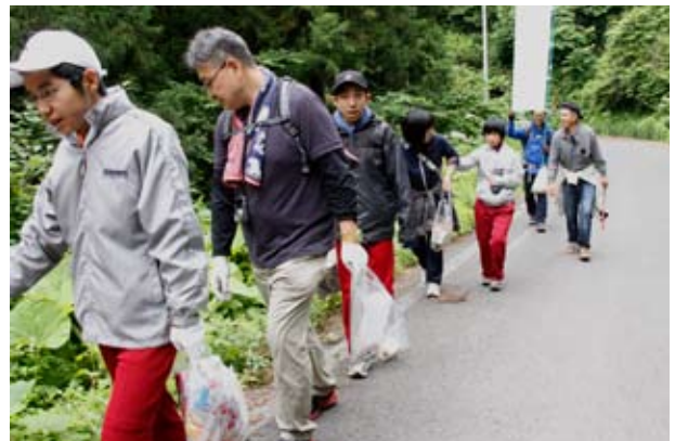
清掃登山をする二戸分教室中学部1班の生徒と関係者の皆さん