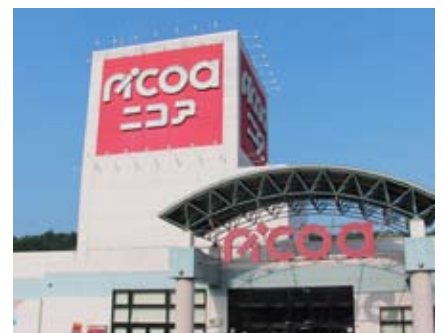
期日前投票所が新設される二戸ショッピングセンター「ニコア」