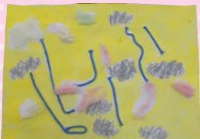
絵画「天につづくきいろい空」