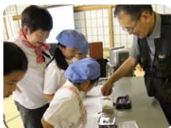
2014年度フェスティバルの様子

・ ・ ・ 問い合わせ・シャトルバス予約先 商工観光流通課 (☎23-7210) ・ ・ ・