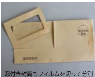
窓付き封筒もフィルムを切って分別