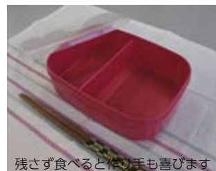
残さず食べると作り手も喜びます