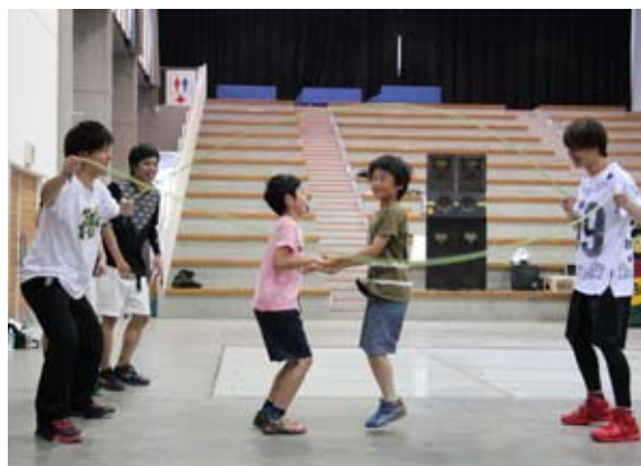
子どもたちと交流を深める岩手県立大学ダブルダッチサークル