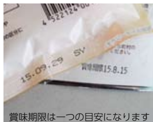
賞味期限は一つの目安になります