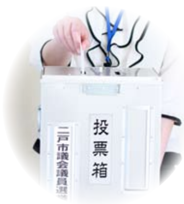
表5. 市議会議員選挙投票所一覧