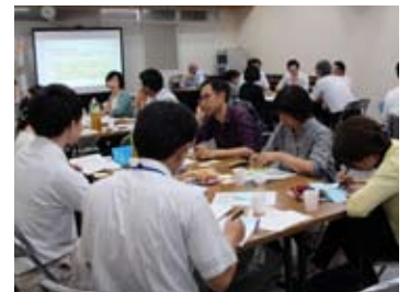
6月19日、福岡・石切所・堀野・米沢地区の第1回ワークショップ

市は現在、平成28年度からスタートする新総合計画の策定作業を進めています。人口減少などの課題を抱える中、市民と一緒にまちづくりを考えるため6月に「二戸市の将来を考えるまちづくりワークショップ」を開催しました。