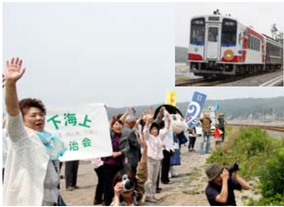
『のだ村エモーション』に参加する下海上の皆さん