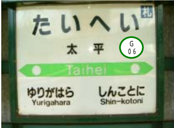
【 ホーム駅名サイン】