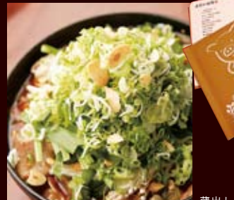
蔵出し「豚ちゃん鍋」 醤油味の「山」880円

◆渋谷駅 徒歩5分 ◆営業/17:00～翌4:00(日曜・祝日・月曜は～23:30) ◆定休日/無休 ◆住所/渋谷区神南1-20-15 国際101号館 B1