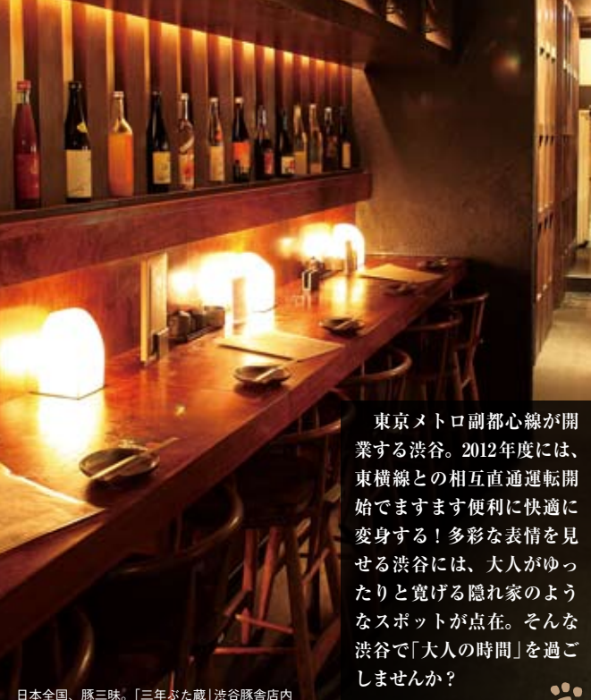
日本全国、豚三昧。「三年ぶた蔵」渋谷豚舎店内

東京メトロ副都心線が開業する渋谷。2012年度には、東横線との相互直通運転開始でますます便利に快適に変身する！多彩な表情を見せる渋谷には、大人がゆったりと寛げる隠れ家のようなスポットが点在。そんな渋谷で「大人の時間」を過ごしませんか？