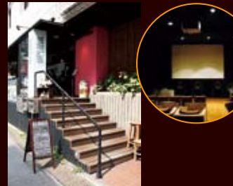
スタンディングな大人の社交場

◆渋谷駅 徒歩10分 ◆営業/施設によって異なる ◆定休日/無休 ◆住所/渋谷区宇田川町37-18 ツツネビル 1・2F