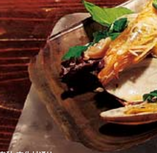
タワーズバー「ベロビスト」