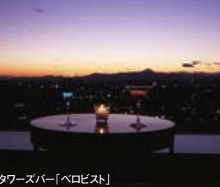
タワーズバー「ベロビスト」