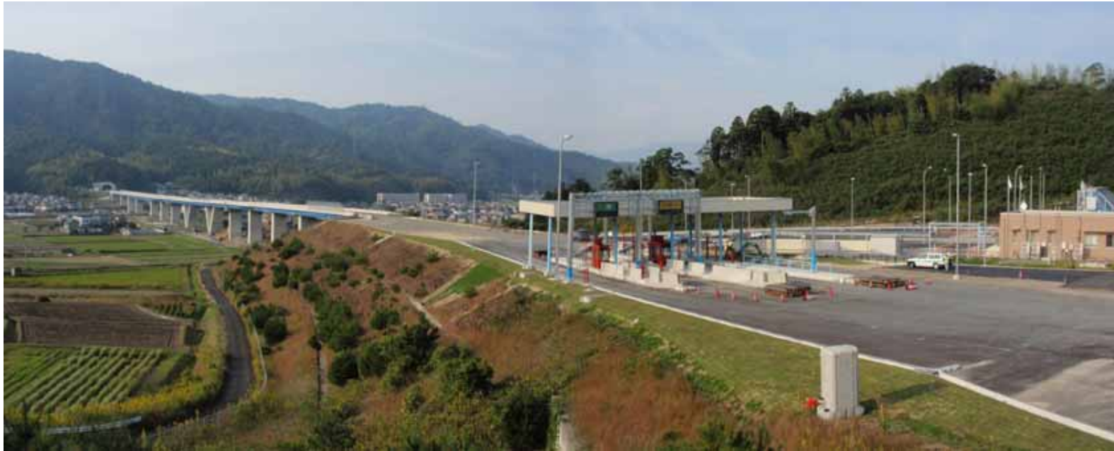
宮津天橋立ICから与謝野町方向を望む(宮津天橋立本線料金所・上宮津大橋・地蔵トンネル)