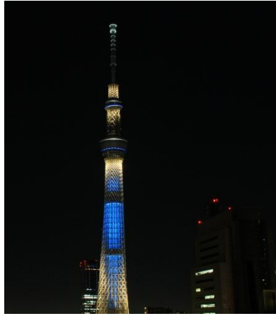
△浅草ハレテラスからの眺望（夜）