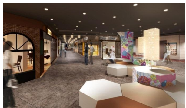
△駅見世ごはん（イメージ）