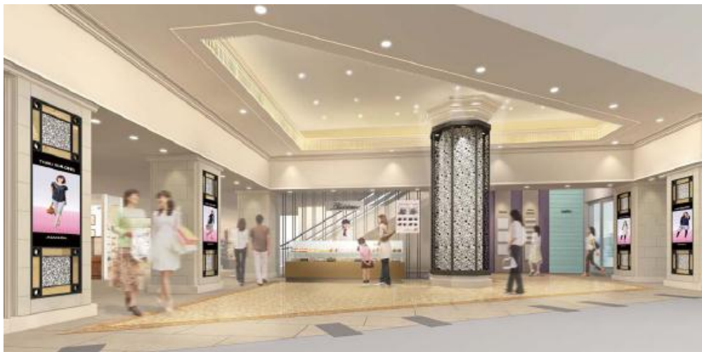
△ 1階 正面口側エントランス (イメージ)