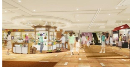
△4階フロア（イメージ）

女性に嬉しいお店が幅広くラインアップ。内装は明るいベージュを基調とし、自然な風合いの素材感や間接照明による柔和な空間演出、適度な休憩スペースの配置により、居心地の良い空間になっています。