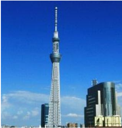
△浅草ハレテラスからの眺望