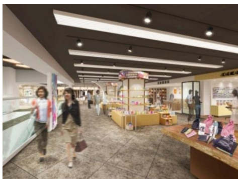
△EAST-TOKYO マーケット わのいち（イメージ）