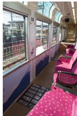
▲スカイツリートレイン車内の様子