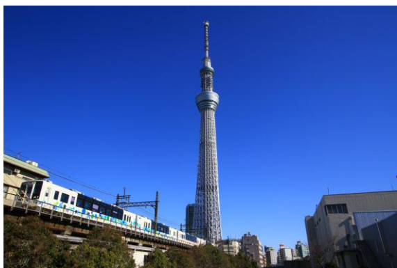
▲東京スカイツリー®とスカイツリートレイン