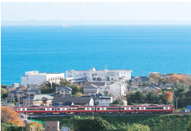
三浦・横須賀方面からの通勤が便利になります