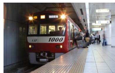
夜間時間帯の羽田空港アクセスが向上