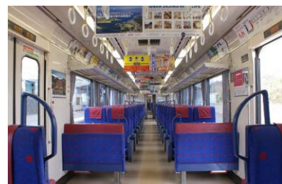
ゆったりとしたクロスシートで快適な通勤に