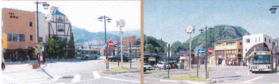
「大月駅」はバス・タクシー・富士急行線、交通の中心地、お食事にも便利!