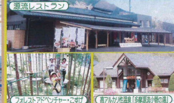
源流レストラン フォレストアドベンチャー・こすげ 高アルカリ性温泉「多摩源流小菅の湯」