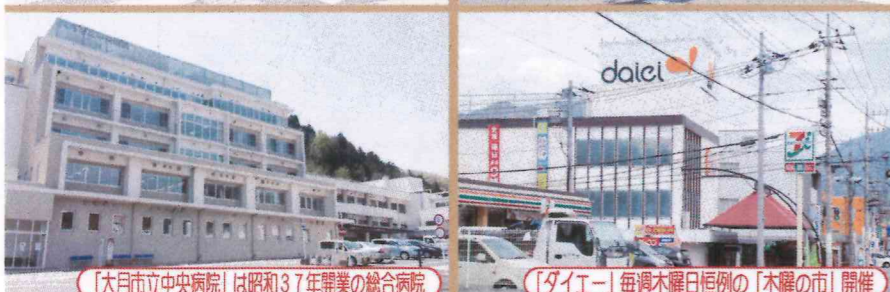
「大月市立中央病院」は昭和37年開業の総合病院 「ダイエー」毎週木曜日恒例の「木曜の市」開催