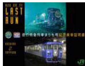
釧路駅発証明書デザイン (イメージ)