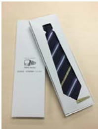
【新 2000 系ネクタイ・ネクタイピンセット】

詳細は、3月31日（火）発行のニュースリリース第 14-087 号「4月12日（日）池袋駅特設会場にて『新 2000 系ネクタイ・ネクタイピンセット』、『池袋線停車駅案内スポーツタオル』を発売します！」をご参照ください。