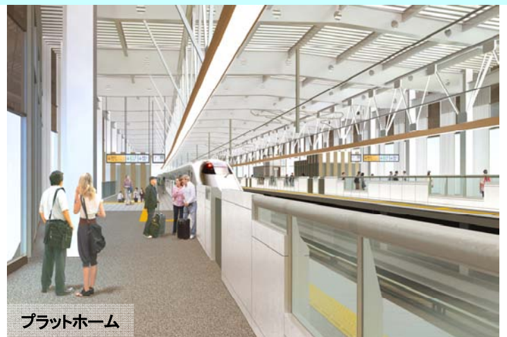
プラットフォーム