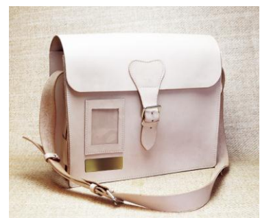
△「東武鉄道旧貨物車掌用カバン」(イメージ)