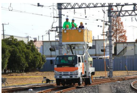
△軌陸両用型架線作業車 体験乗車