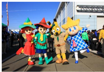
△昨年の「東武ファンフェスタ」の様子