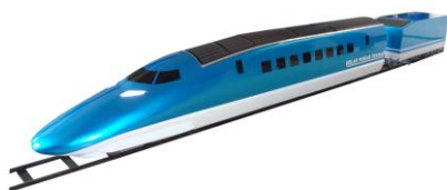
△ミニトレイン（イメージ）

ミニトレイン（ソーラーパワートレイン）の運転や、小さいお子さまに大人気のエア遊具フワフワ（タイガージム）を設置します。