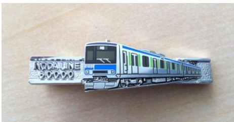
△「60000系車両ネクタイピン」(イメージ)