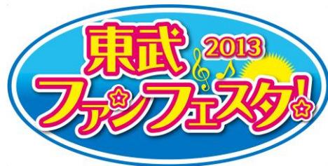
△「2013 東武ファンフェスタ」ヘッドマーク(イメージ)