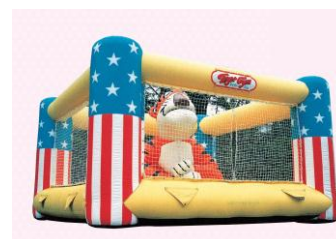
△フワフワ（イメージ）