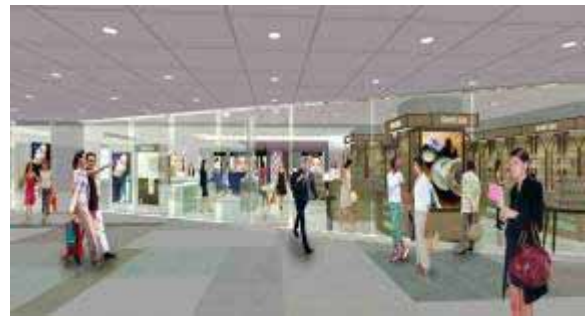
2階南側のエントランスはガラス張りで開放的に！

2 階は、南側地下1階と1階からのエスカレーターでつながり、アクセスがとてもしやすい便利なフロア。ガラス張りでの外の景色が見える開放的で魅力的な空間へと一新します。この便利なフロアに、多忙でも“キレイ”を重視する大人の女性のニーズに対応し、「キレイに関するコスメアイテム・サービス」を1フロアに集結します。新ブランドも加わり、全 37 ブランドを展開。売場面積は、改装前の1.5倍に拡大します。