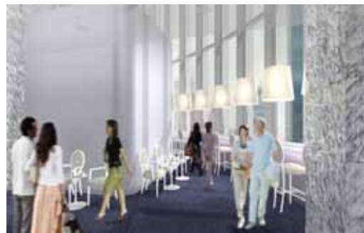
吹き抜け部分の喫茶 レディスメンバーズサロンは、3/5 オープン予定