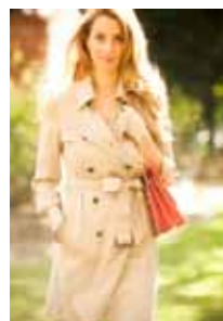
<ボルニー> 今シーズンデビュー