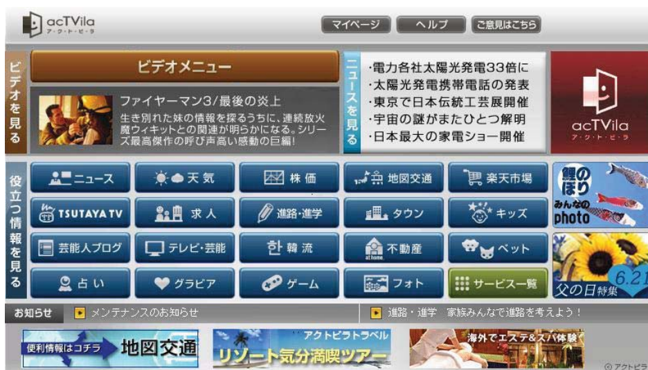
アクトビラトップ画面イメージ