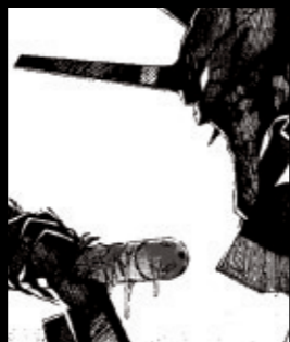
Volume 6 四人目の適格者

トウジが乗る参考機が使徒としてシンジと対峙。シンジは殲滅を拒否するが、ダミーシステムによってトウジもろとも参考機は沈黙する。