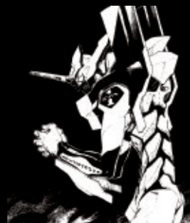
Volume 11 手のひらの記憶

アダムから生まれたカヲル。アダムから生まれたエヴァ。白い巨人の名はリリス。ゼーレによる NERV 本部の直接占拠が始まる――。