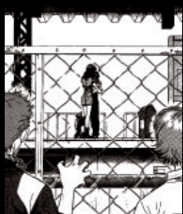
Volume 2 ナイフと少年

エヴァに乗ってプログレッシブナイフを振り回す反抗期の子供のようなシンジ。そんな彼をミサトは家族として包み込んでいく。