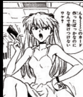
Volume 4 アスカ、来日

冒頭から全編にわたってアスカが活躍。式号機のアクションシーンやシンジとのユニソンの練習などのコミカルな場面も見どころ。