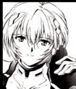
Volume 3 白い傷跡

ヤシマ作戦で使徒を殲滅する際、盾となってシンジを守ったレイ。シンジによってエントリープラグから救出されたレイの笑顔がまばゆい。