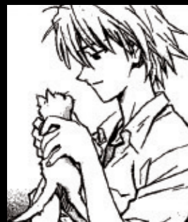
Volume 9 フィフス・チルドレン

カヲルがフィフス・チルドレンとして NERV に赴任。精神汚染によって深刻なダメージを受けたアスカに代わってカヲルが式号機に乗る。