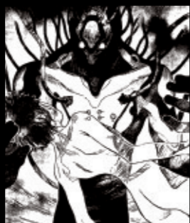
Volume 8 MOTHER

LCLに溶けたシンジは母・ユイに再会。冬月の回想によって NERV 創設当時のゲンドウやユイの姿を描き出し、加持が最期を迎える。