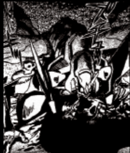
Volume 7 男の戦い

トウジの死で逃避するシンジを加持が説得。使徒との戦いの末に初号機が覚醒する。コミック版でしか描かれないう加持の過去も明らかに。