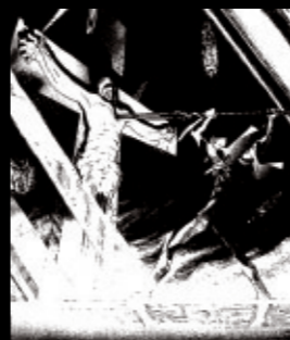
Volume 5 墓標

ユイの墓標の前で語り合うシンジとゲンドウ。加持の素性も明らかになり、アダムをはじめ物語の核心に関わる事実が暴露されていく。