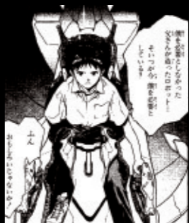
Volume 1 使徒、襲来

エヴァに乗るために、いや乗せられるためにゲンドウに呼び寄せられたシンジ。異形のエヴァの咆哮と父子の断絶がせつない。