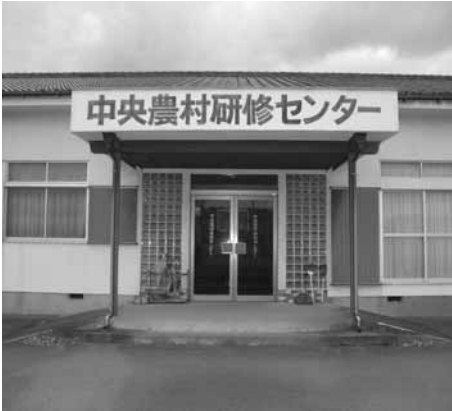
お問い合わせ 産業振興課農政担当

中央農村研修センターを、3月末日で廃止します。長きにわたるご利用ありがとうございました。