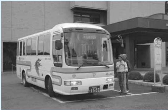
問い合わせ 企画課企画調整・人権推進担当