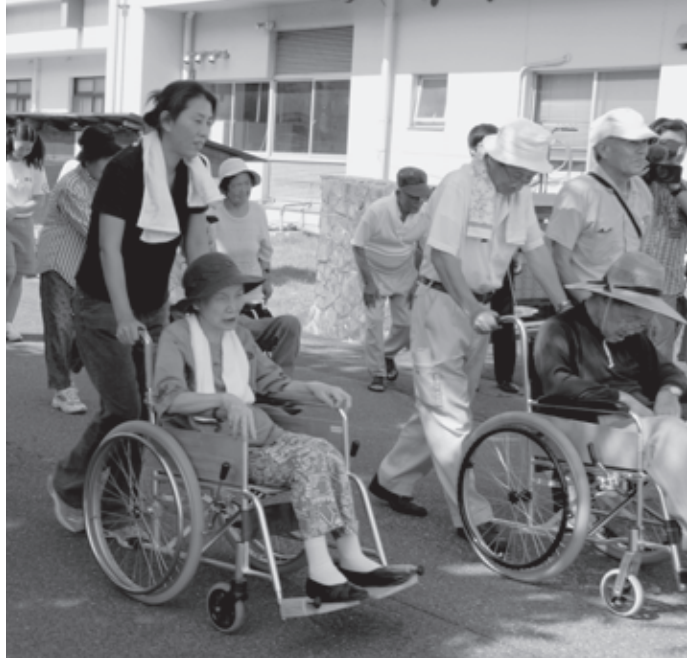
昨年9月に村松公園周辺で実施した 県総合防災訓練の避難訓練