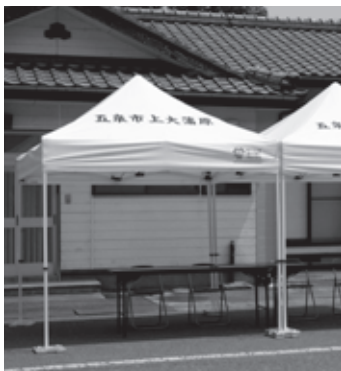
上大蒲原町内会・集会用テントなど