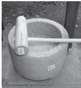
不動堂町内会・餅つききね・臼など