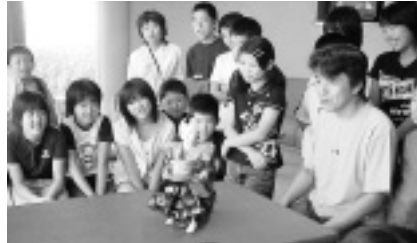
どうやって動くのだろう？