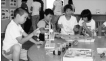
うまくできるかな