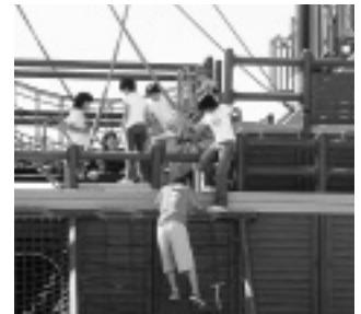
ふみはずさないように