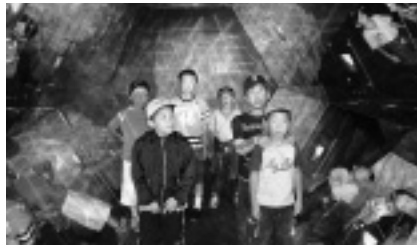
ふしぎだな？ ほくがいっぱい