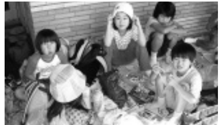
おいしい笑顔がこぼれてる