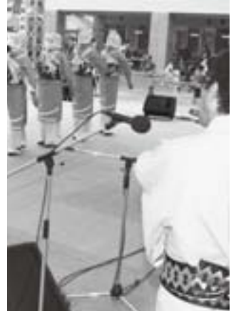
御経塚じょんがら保存会