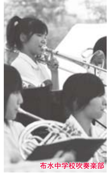
布水中学校吹奏楽部