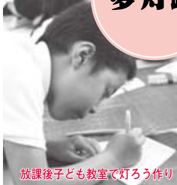
放課後子ども教室で灯ろう作り