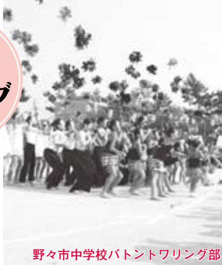
野々市中学校バトントワリング部