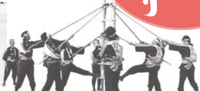
フレッシュじょんから市