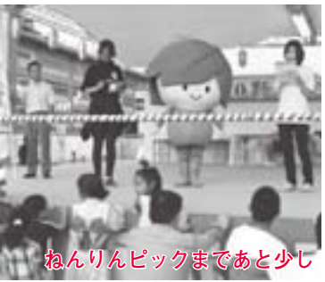
ねんりんピックまであと少し