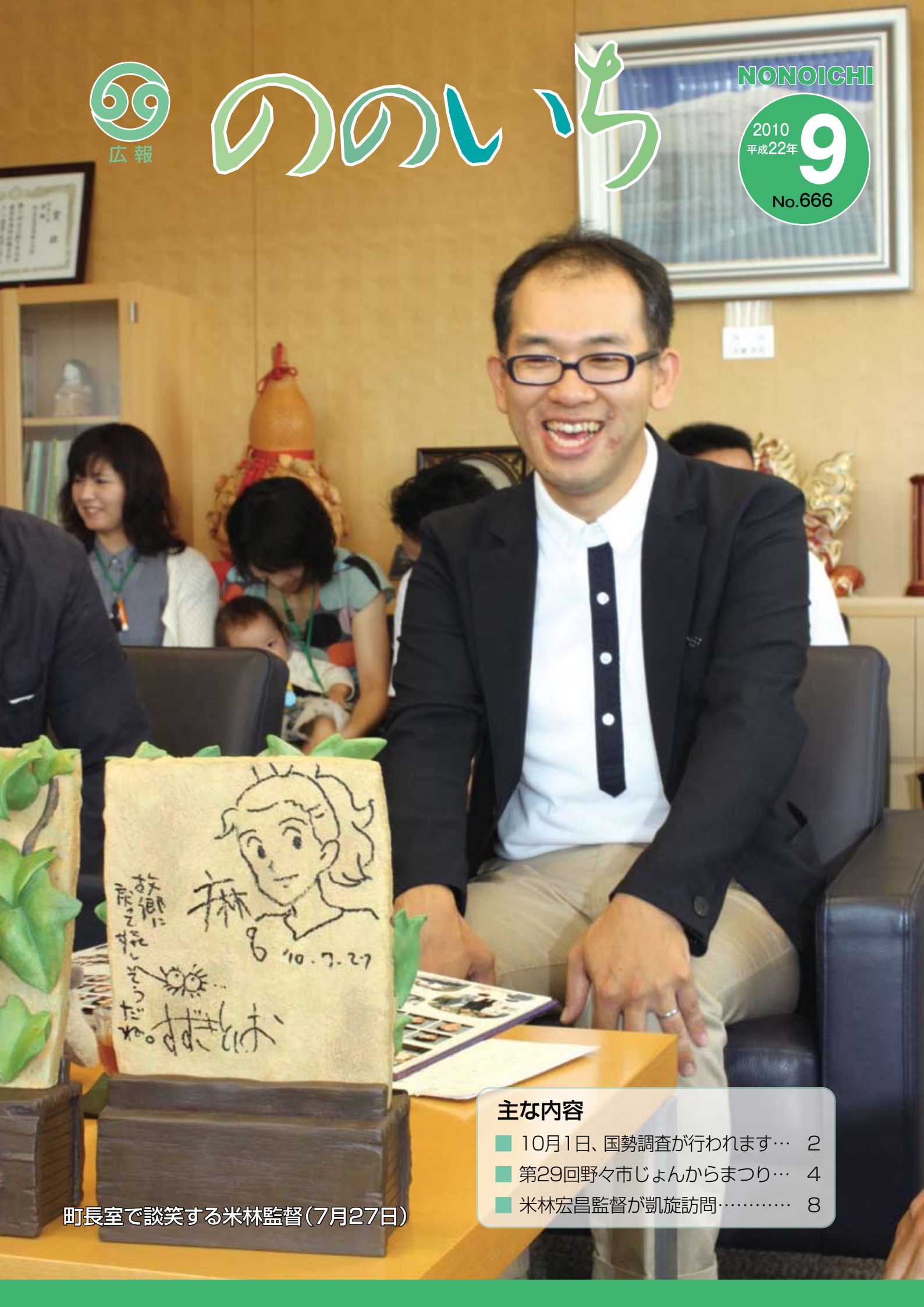
町長室で談笑する米林監督(7月27日)