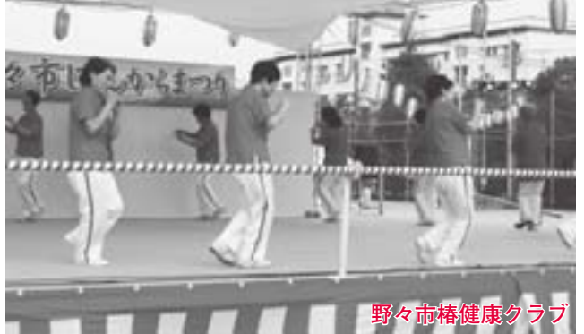
野々市椿健康クラブ

初日のメインイベントである、野々市じょんからの総踊りでは、浴衣姿の美しい踊り子たち約千人が踊りの輪を囲みました。同時に開かれた踊りの大会では、初参加の県立大学チームや、金沢工業大学チームなど地域の学生も加わり、夏の夜を盛り上げました。