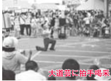
大道芸に拍手喝采