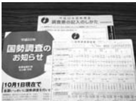
↓総務省統計局 2010 国勢調査 キャンペーンサイト

調査員を装った「かたり調査」にご注意ください。 調査員は「国勢調査員証」「国勢調査従事者用腕章」を身につけています。不審に思った場合は回答せず、すぐに国勢調査野々市町実施本部まで問い合わせください。