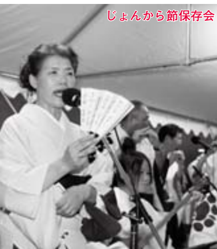
じょんから節保存会