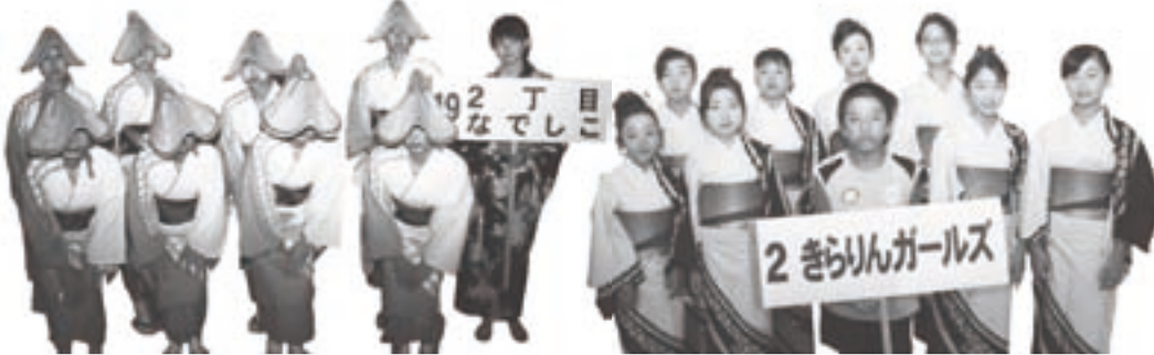
子どもの部 野々市じょんから賞