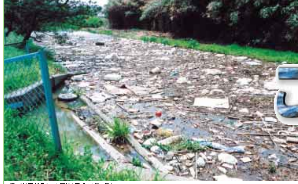
ゴミで川面が埋まった西川(平成14年5月)