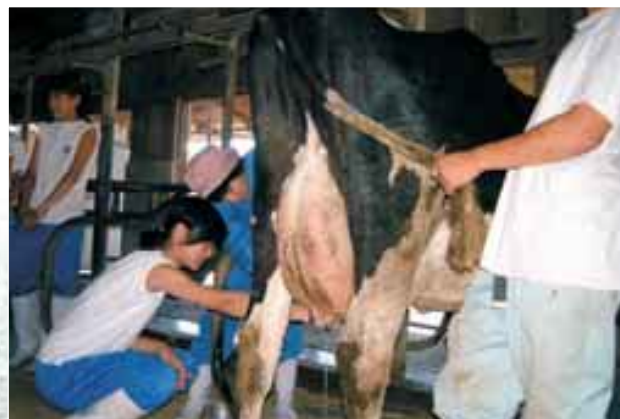
大地の子農業体験研修