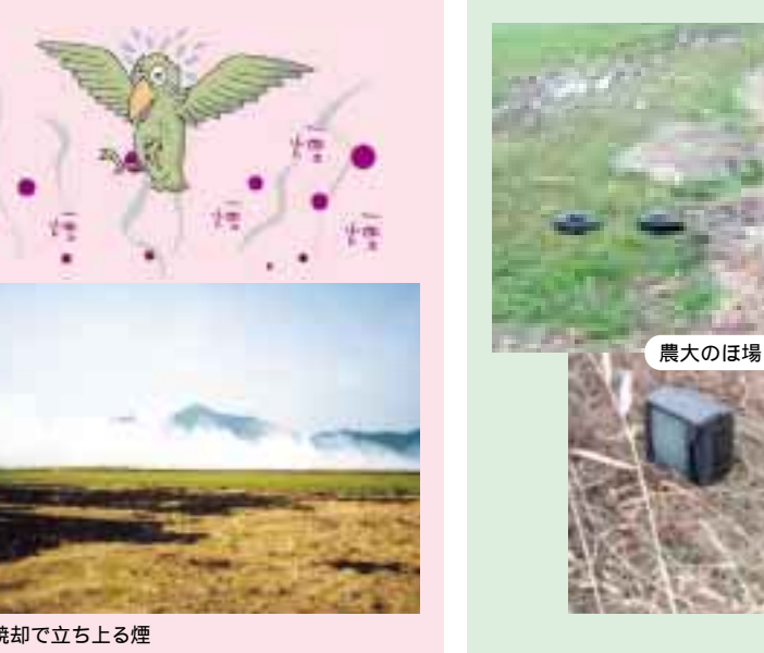
稲わら焼却で立ち上る煙