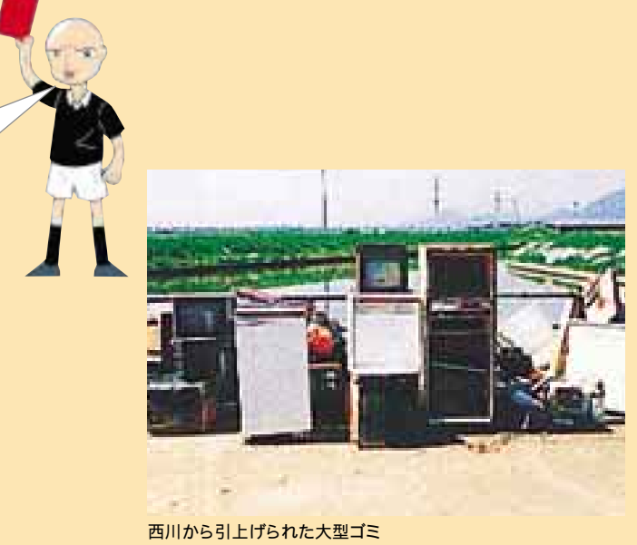
西川から引上げられた大型ゴミ