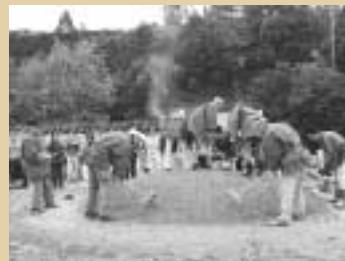
昔ながらの窯うちを再現