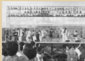
南勢町水産振興まつり