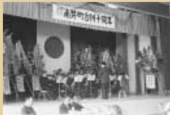
町制施行10周年記念式典

ソ連の宇宙衛星船で人類初の宇宙遊泳 名神高速道路開通 朝永振一郎ノーベル賞受賞 日韓条約調印