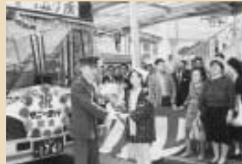
サニ-急行バス運行