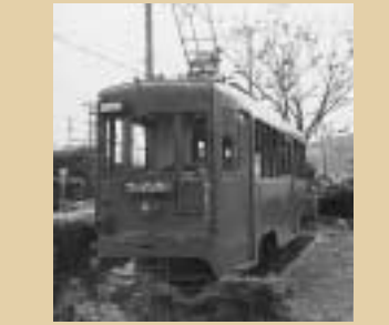
五ヶ所児童公園のチンチン電車