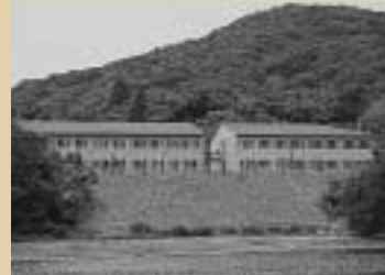
水産庁養殖研究所

NHK衛星TV放送開始 ロス五輪 グリコ・森永脅迫事件 三種の新札発行 植村直己マッキンリー単独初登頂