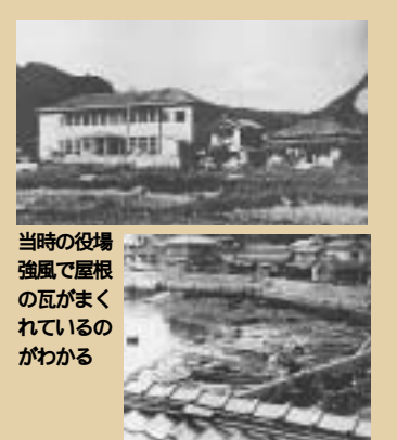
当時の役場 強風で屋根の瓦がまくれているのがわかる

1963年（昭和38年） 4月1日 町内全保育所町立となる 4月30日 岡本町長三選 12月11日 南海中学校鉄筋校舎落成式