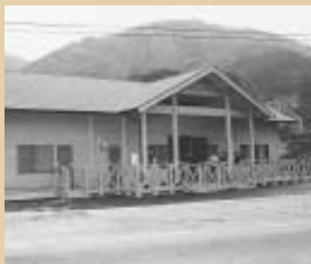
内瀬体験加工施設

中山間地域総合整備事業の一環で、内瀬に地元の産品などを販売、加工体験できる『内瀬体験加工施設』が完成。青空市などを定期的に開き、新鮮で安全なふるさと産品を販売している。尚、運営・管理は農村公園「ないぜいぜん村」に委託。