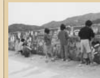
モルフェ 岡本太郎の作品「若い太陽」