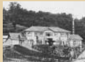
町立病院となる前の大安病院

初の「建国記念日」 高見山、初の外国人開取になる 青海マラソン開催、市民マラソンの先駆