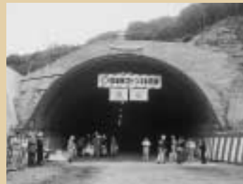
宿浦第3トンネル貫通