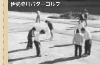
伊勢路川バタ-ゴルフ