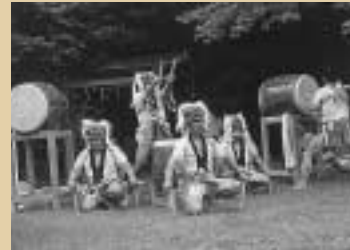
南勢牛鬼太鼓保存会