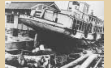
海岸にうちあげられた巡航船

ケネディ、大統領に就任 ソ連のガガーリン少佐、人類初の宇宙飛行 東独政府、ベルリンに壁を作る 所得増進計画 農業基本法の成立