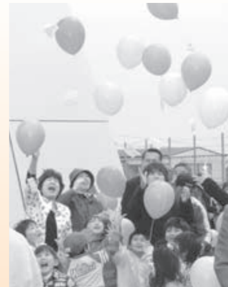
▲花の種を付けた風船に願いを込めて、大空に放ちました。

4月28日の公園の開園式と合わせて、政令指定都市誕生を記念したイベントも行われました。