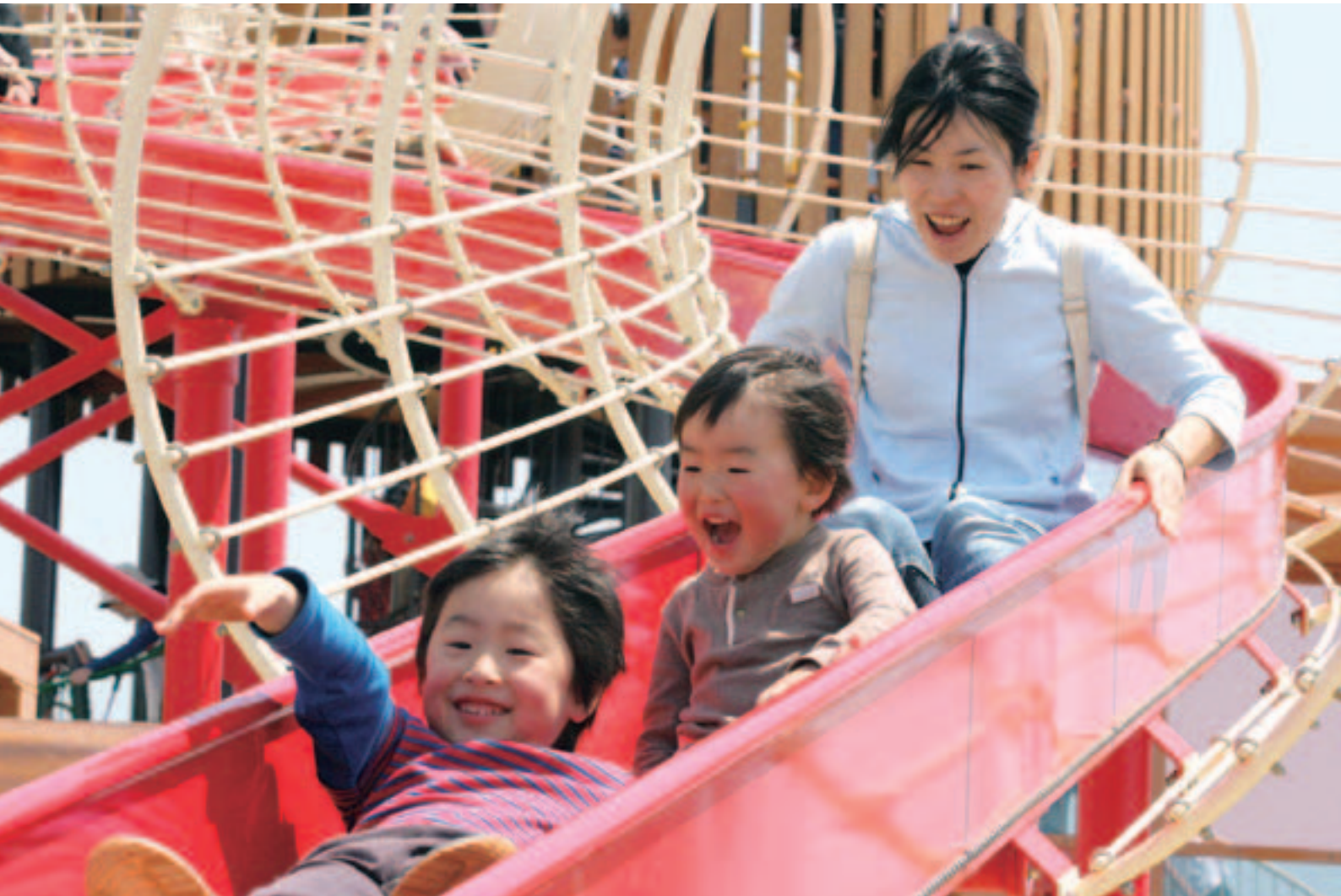
山の下みなとランド「ローラーすべり台」