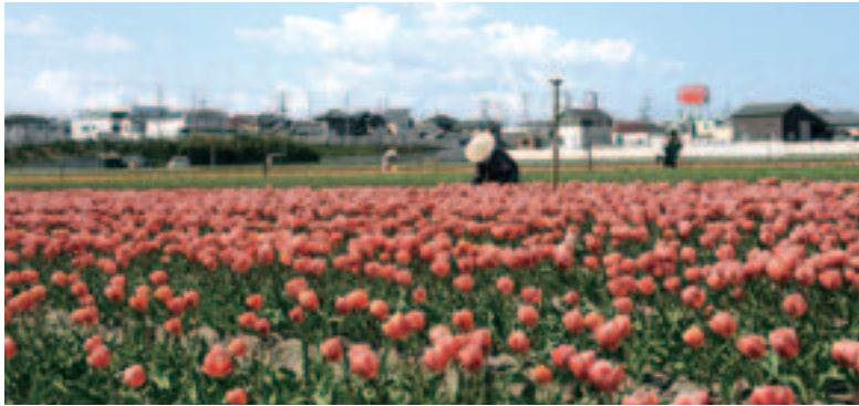
今も昔も変わらない春の風景