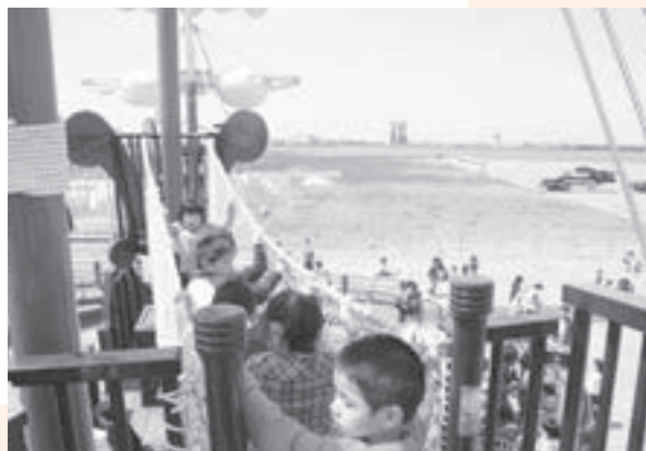
▲船の上からは、信濃川河口を望めます