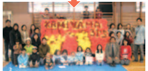
ヤッター完成！みんな集まってハイ・ポーズ