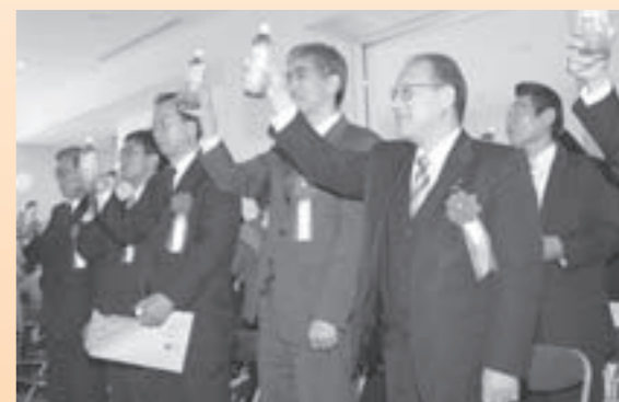
▲政令市の船出を祝して、「かんぱーい」