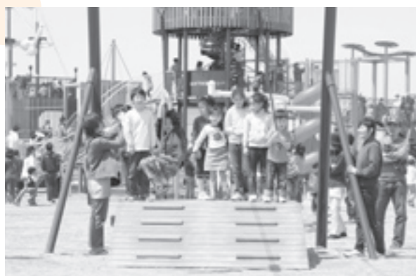
▲筋力とバランス感覚を養える「ターザンロープ」。このほか、大人向けの健康遊具もあります