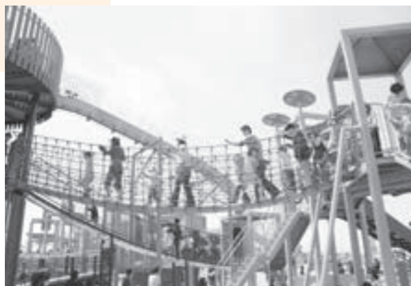
▲はしごを渡って、隣の遊具へ移動。まるで探検隊になった気分…