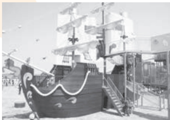
▲帆船の形をした遊具「夕焼けハンターキャプテン号」。船の中に入ってみよう