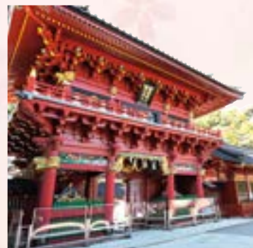
江戸時代の大造営で再建された神部神社・浅間神社の楼門(重要文化財)

Shizuoka City Museum of History 静岡市歴史博物館