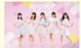
※スケジュールは予告なく変更する場合がありますのでご了承ください