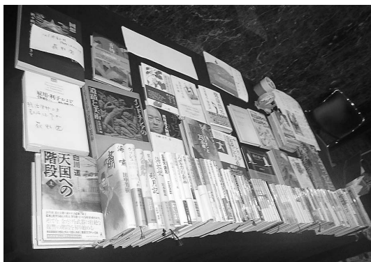
質実剛健の静高生らしい本が多く見受けられました。

「本当に本集まるのかしら?」という一抹の心配は杞憂でした。「売っているの?」というご質問が出るくらい「古書コミコーナー」には、本が集まりました(写真参照)。ざっと一五〇冊が手元を集まり、最後は段ボール1個に何とか納めて古本業者に送りました。