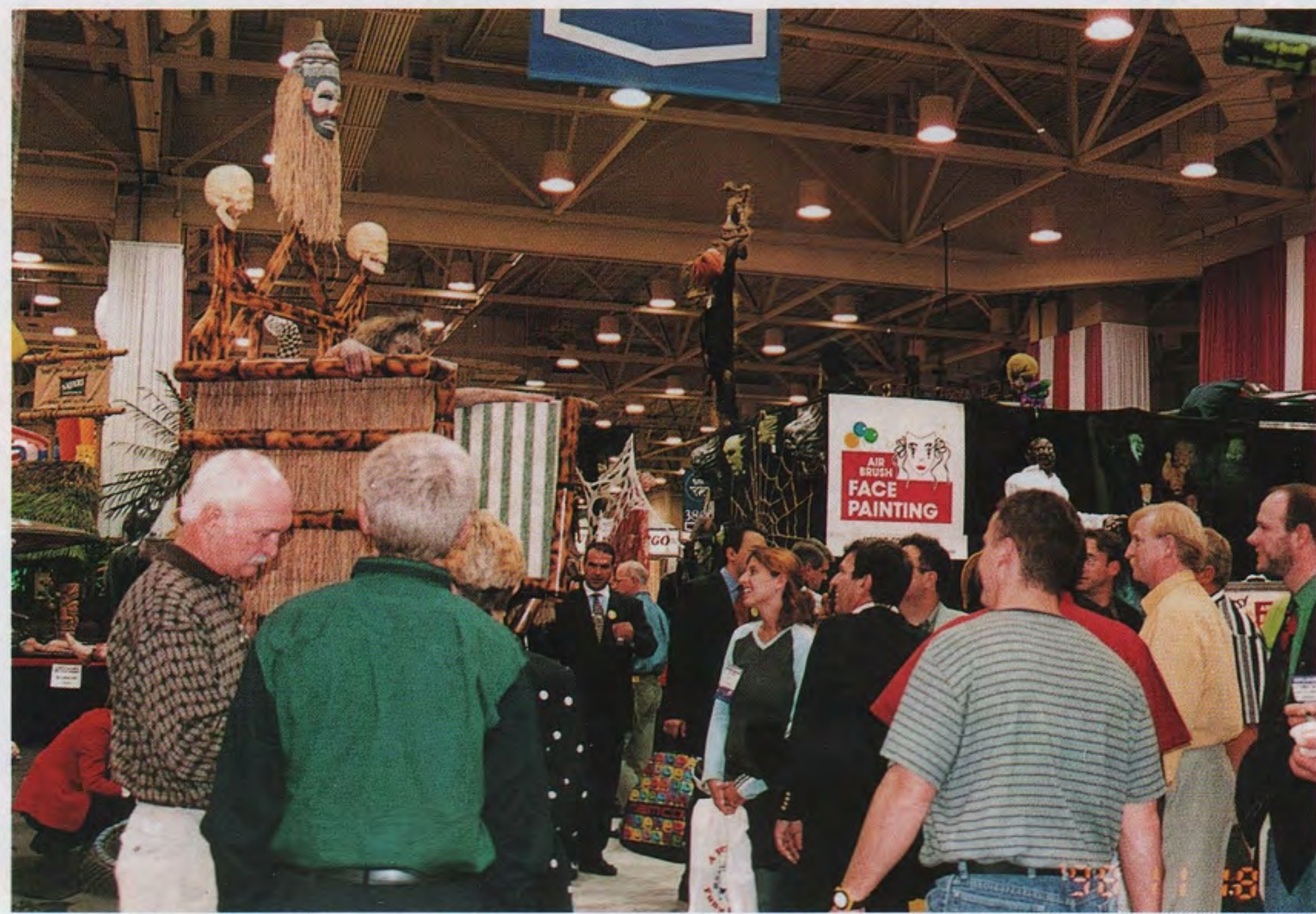
I AAPAショー98で大きな関心を集めた米国モリス・コスチューム社の「ウィッチドクターズ・レベンジ」(左中央)

遊園地関係の世界的な展示会、I AAPA (インターナショナル・アムusement・ショー・オブ・アメリカ)が11月18日(土)から21日(水)まで、米国テキサス州ダラスのコンベンションセンターで開催され、約四万平方メートルの屋内フロアと四千六百平方メートルの屋外展示場に約千社が出展、さらに充実させた。