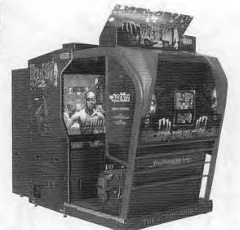
ザ・ハウス・オブ・ザ・デッド 2(スーパーDX)

昭一郎社長)から、CGガンゲーム機「ザ・ハウス・オブ・ザ・デッド2」が十一月二十六日発売となった。