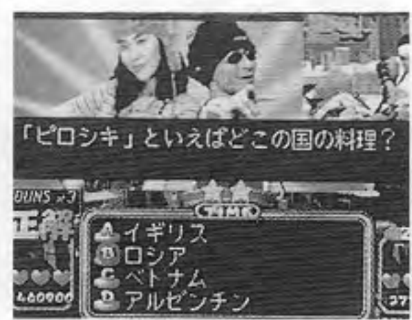
グルメバトルクイズ料理王

完成した料理が映し出される。四択クイズが基本だが、アイテムにより二択や三択にもなる。一定数間違えるとゲーム終了。一人用でコンピュータ側にも勝つと実在料理店のお勧めメニューを表示。また実写撮影込みで演出もある。サブ基板OPP価格九万八千円、マザー基板とのセットで十四万八千円。