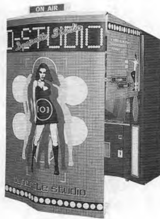
ダイナミックスタジ

ナムコから「クールガンマン」がセンサに銃の光線が当たるとそのパネルが勢いよく数センチ程度跳ね上がり、上に乗った缶を弾き飛ばすという仕組みになっている。