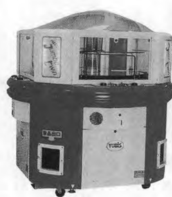
NEW JUMBO TWIN