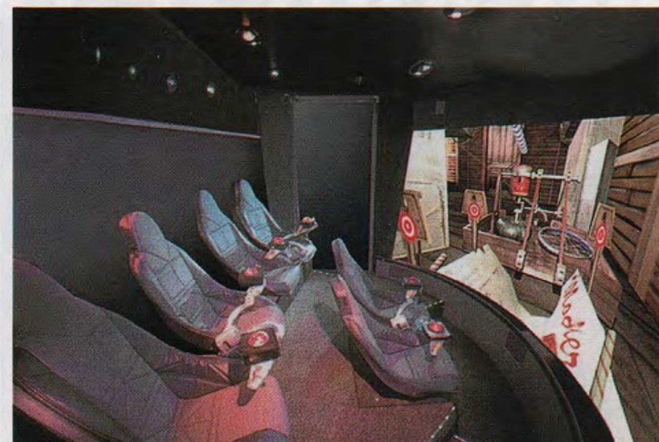
日立「シミュレーションライドシアター」の座席とスクリーン

日立製作所(本社東京、金井務社長)は十一月十八日、映像シミュレーターを製造、販売することを明らかにした。日立はCG、VR、シミュレーション、映像など幅広い技術を活用する。001年宇宙の旅「プロトパック」など、有名人が出演する。九八年八月、新事業推進本部内に「映像シミュレーション」を設置。九八年二月にダグ・フューチャー(九三年「シークレッツ」監督が提携し、「シミュレーション」を制作)と提携。映像シミュレーションの開発技術と、推進本部内に「映像シミュレーション」を設置。九八年二月にダグ・フューチャー(九三年「シークレッツ」監督が提携し、「シミュレーション」を制作)と提携。映像シミュレーションの開発技術と、推進本部内に「映像シミュレーション」を設置。九八年二月にダグ・フューチャー(九三年「シークレッツ」監督が提携し、「シミュレーション」を制作)と提携。