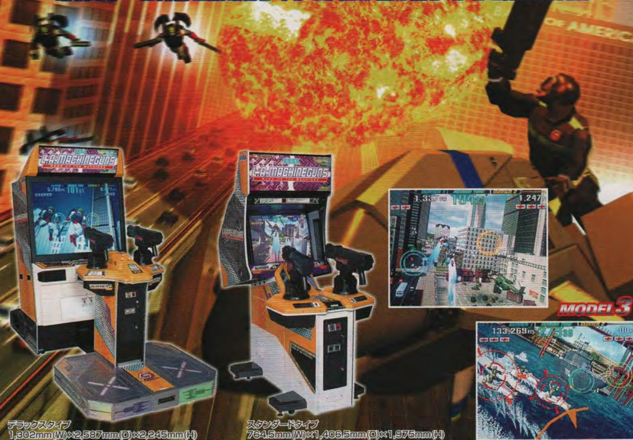
1,602mm(W)×2,357mm(D)×2,243mm(H) 55kg AC100V 45W 50インチラプロジェクトTV

スピード感あふれる空中戦! 振動が伝わる弾数無制限連射式マシンガン! 明快なゲーム内容と破壊のダイナミズムが生み出す、かつて無い爽快感。