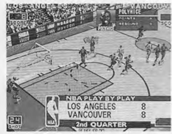
NBAプレイ・バイ・プレイ

コナミ(本社東京、上月景正社長)から、CGバスケットボールゲーム「NBAプレイ・バイ・プレイ」が十二月二十一日発売となる。