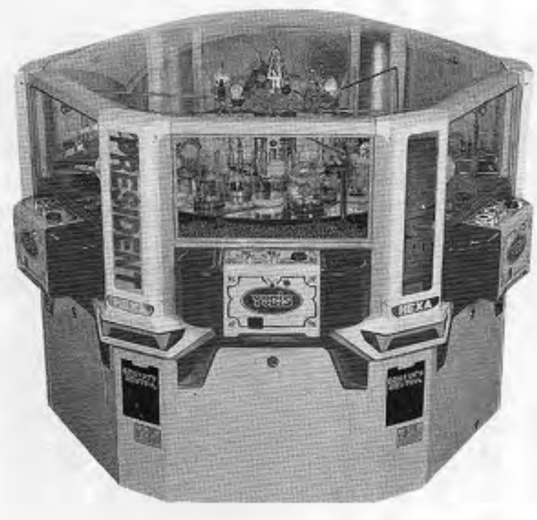
NEW HEXA PRESIDENT