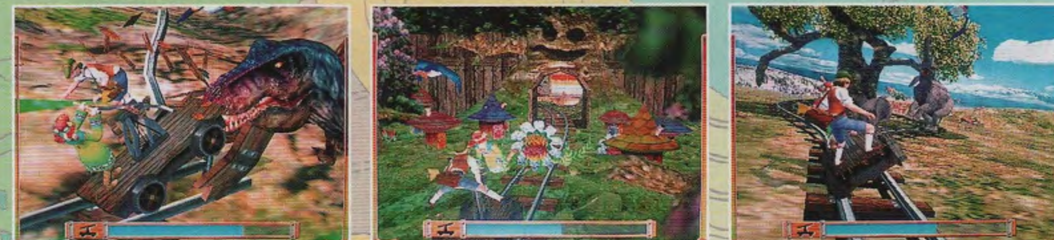
1,170mm(W)×2,450mm(D)×2,280mm(H) 39kg AC100V 452W 50インチラプロジェクトTV