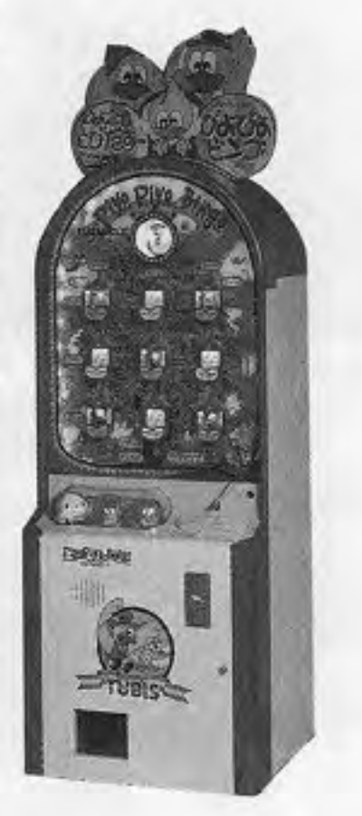
PIYO PIYO BINGO