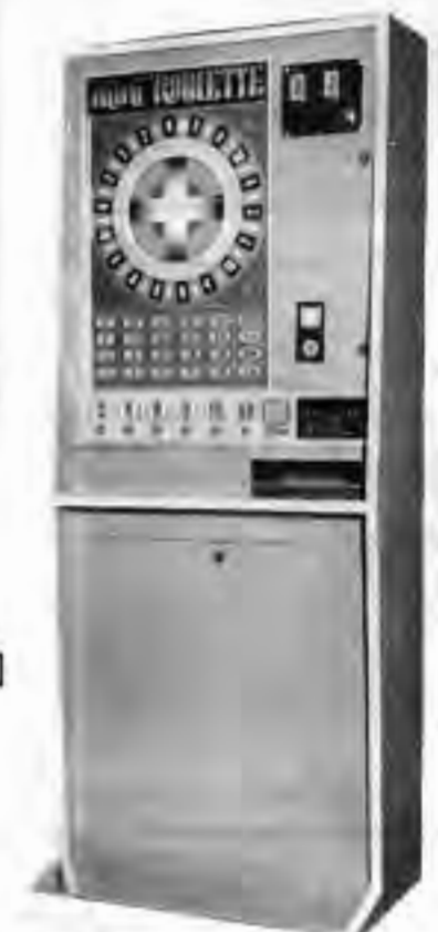
MINI-ROULETTE 豪華なキャビネットのICマシン!!