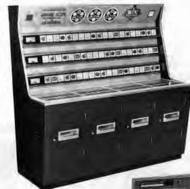
SUPER STAR リズムと組合せの面白さが人気の秘密