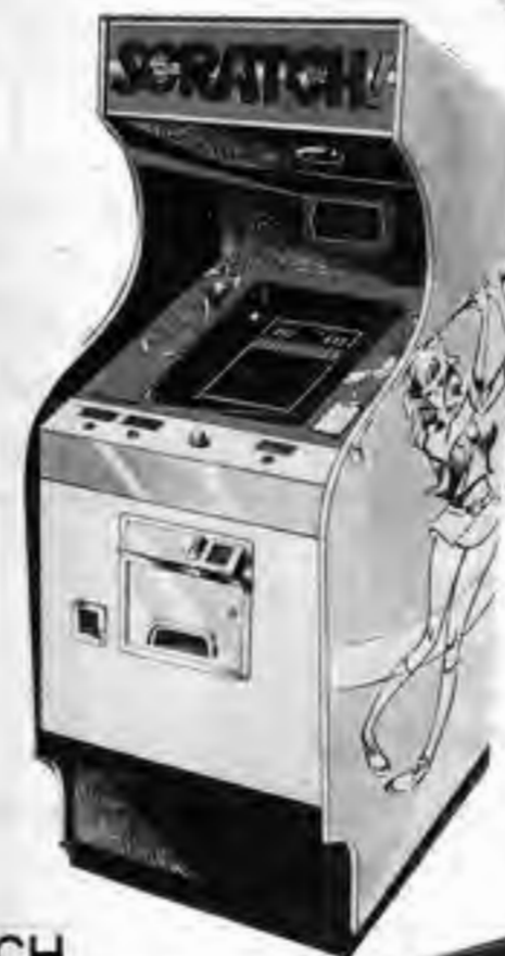
SCRATCH 星を消していくスリリングなTVゲーム!! 最高得点が自動的に表示されます