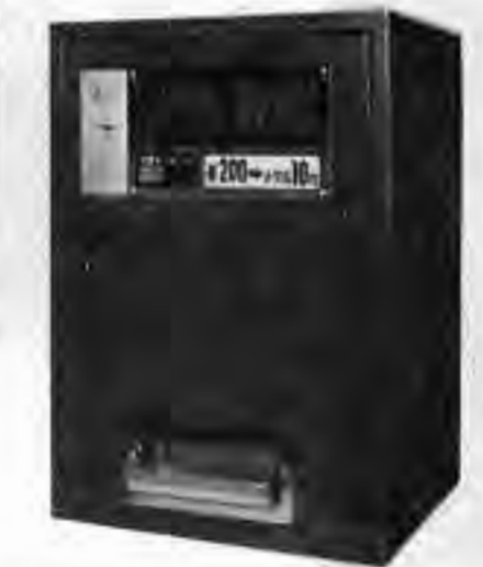
▲UNI 1000 1000円札を100円玉に