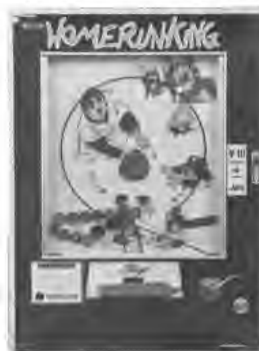
ホームランキング