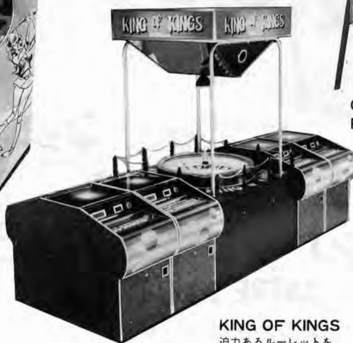
KING OF KINGS 迫力あるルーレットを豪華なマスゲーム機で