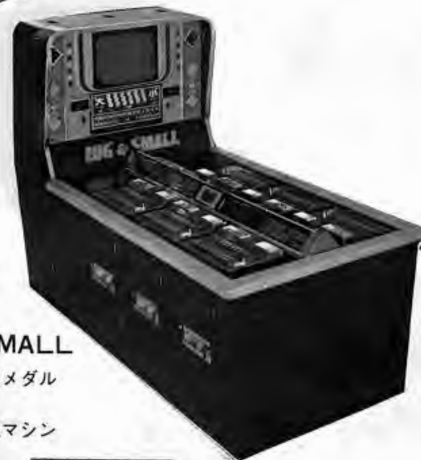
BIG & SMALL 大小の遊びをメダルゲームに。 最も長い人気マシン