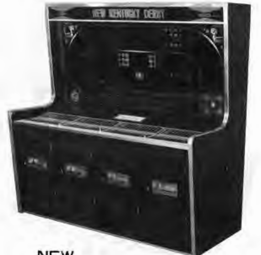
NEW KENTUCKY DERBY ゴージャスなムードのダービーゲーム