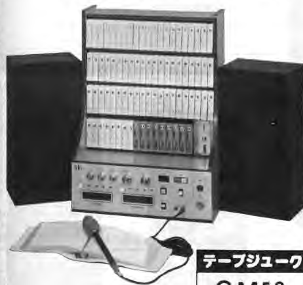
テープジューク GM53 関西ジューク(株)

* GM53は最高品質で故障知らず、コンパクトで高い耐久性など——すべてにわたって、オペレーターの身になって作られた完成品です。 * アンブ仕様 高さ650mm、横幅490mm、奥行300mm。コインシューター、テープケース(80本収容可能)付。 * テープは現在70本。スピーカー、マイク、歌詞集など付属。 * アンブ電気関係 AC50/60Hz 100V、最高出力110W。出力40W(20W×2ch)、使用マイク600Ω(アンブ感度1.5mV)。