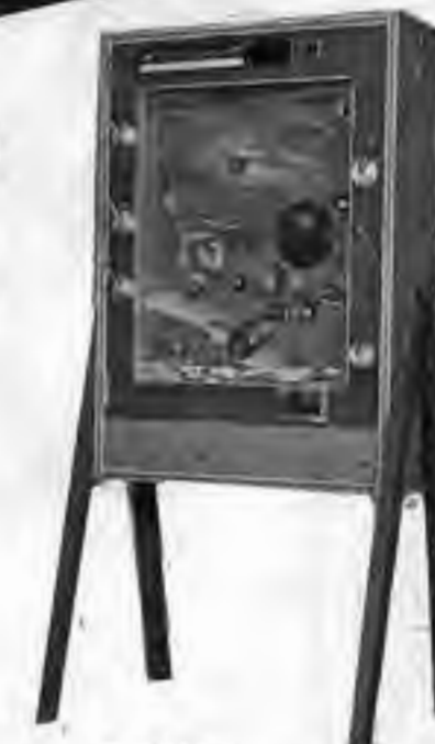
COIN ROCKET 月面に着地するゲーム。チャンスも2回