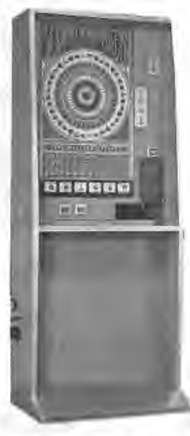
ブルーインパルス