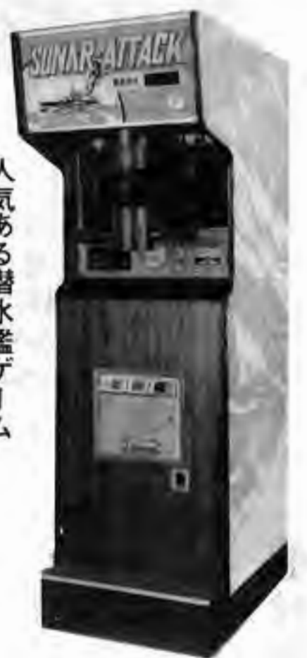
SONAR ATTACK 人気ある潜水艦ゲーム