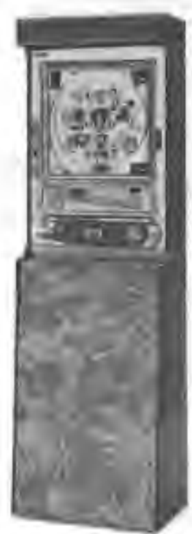
コンピューターパチンコ