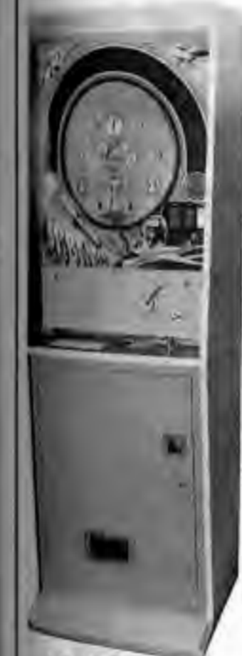
ICBM 入賞穴に入ると爆発音の音響効果電子音がプレー時間を知らせます