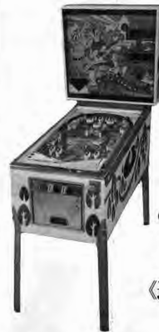
ORIENTEERING マイクロプロセッサ使用のフリッパー