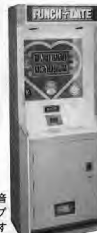
PUNCH DE DATE 貴方もラブチャンスを!!