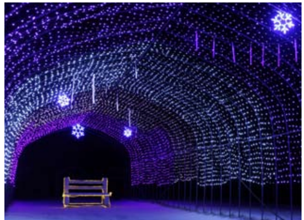
光のトンネル。中央のベンチで愛を語り合ってみる？！