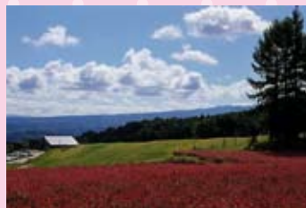
木村会長の作品「赤い蕎麦」(上)、 「水面に映る男神岩」(右)

現在の会員は9人ですが、若い方の入会をお待ちしています。春の桜、夏の海、秋の紅葉、冬の雪景色や四季の行事などを、一緒に写してみませんか。