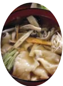
郷土料理のお振る舞い(イメージ)

【お願い】会場の駐車場には限りがありますので、できるだけ乗り合いや公共交通機関を利用しお越しください。