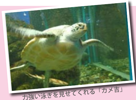
力強い泳ぎを見せてくれる「カメ吉」

八戸市水産科学館マリエントでは、東日本大震災後、久慈市の「もぐらんぴあ」から「もぐらんカメ吉」をお預かりしています。ほかのカメや魚たちと仲良く元気に泳ぐカメ吉に、ぜひ会いに来てくだ