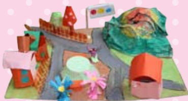
工作「自然いっぱいいたのしいまち」