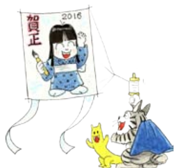
イラスト：きり光乗