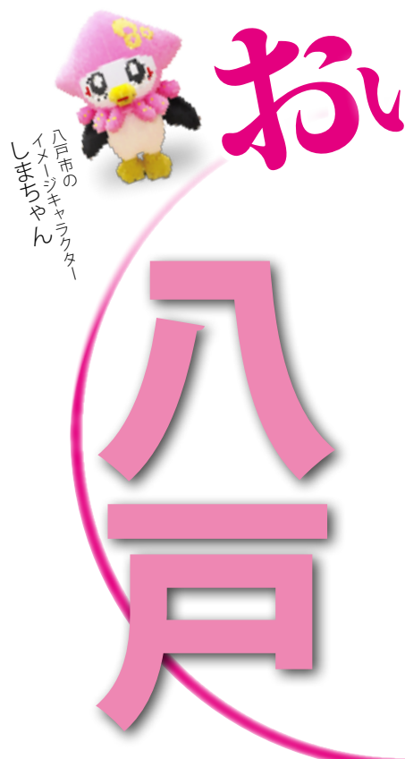
八戸市のイメージキャラクター「ハチカちゃん」です。