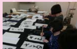
真剣な表情で半紙に向かいます(ワークショップの様子)