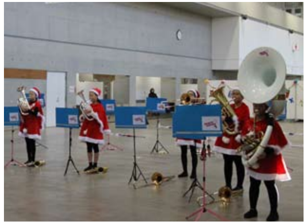
6 年生メンバーが思い出の曲を披露するコーナーも