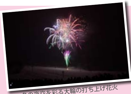
冬の夜空を彩る大輪の打ち上げ花火