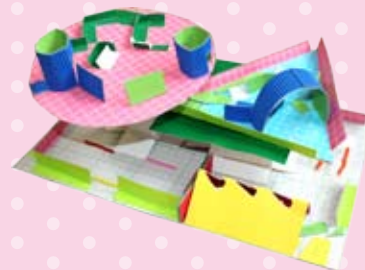
工作「トラップ迷路」