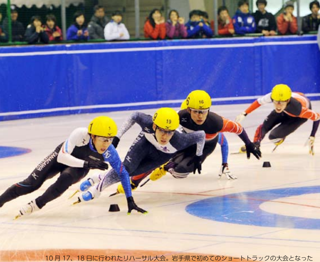
10月17、18日に行われたリハーサル大会。岩手県で初めてのショートトラックの大会となった