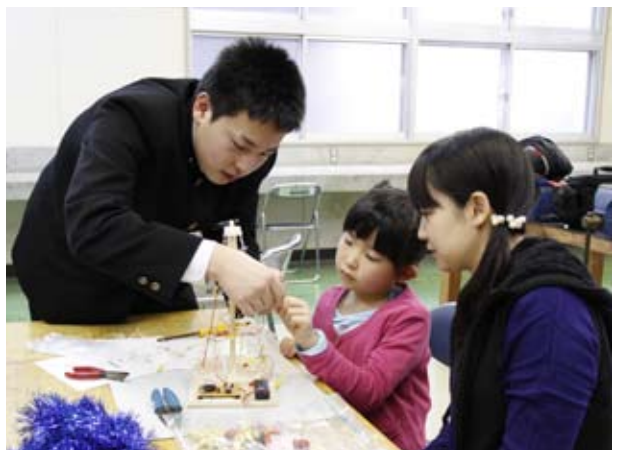
高校生のお兄さんと一緒に LED を配置している様子