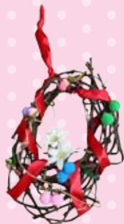
工作「クリスマスリース」