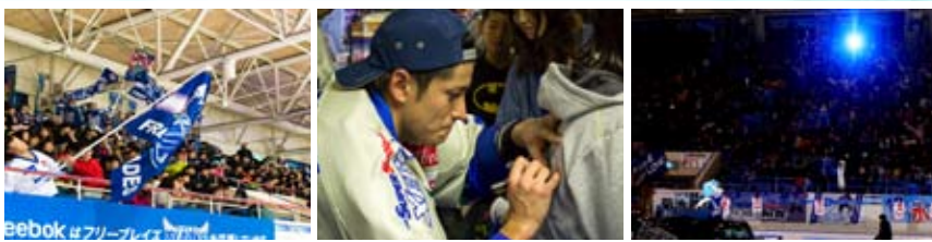
左／躍動するアスリートに会場は大興奮 中／試合終了後はサイン会で選手との触れ合いも 左／ピリオドの間のインターバルも見所満載