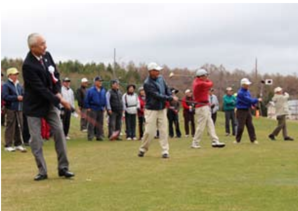
「ナイスショット！」今シーズンはいくつ出せるでしょうか？

稲庭高原パークゴルフ場はことしのシーズンインを迎え、4月21日に行われたオープン式には関係者やプレイヤー約80人が参加しました。