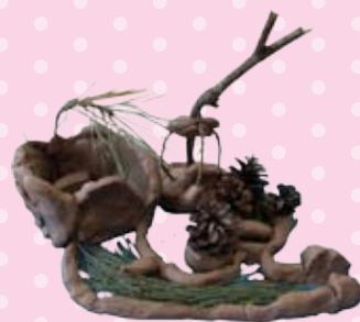
粘土工作「ビッグカブトハウス」