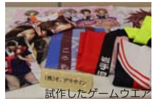
試作したゲームウエア