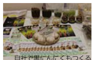
自社で黒のにんにくもつくる