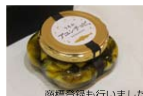
商標登録も行いました