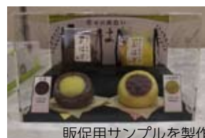
販促用サンプルを製作