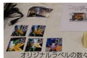
オリジナルラベルの数々