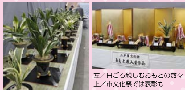
左/日ごろ親しむおもとの数々 上/市文化祭では表彰も