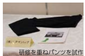
研修を重ねパンツを試作