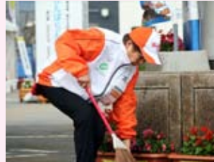
会場での美化活動の様子

報酬など 活動や研修などの参加に係る報酬は無償で、食事代、交通費は自己負担です。スタッフジャンパーなどは貸し出します。活動や研修のときは、実行委員会の負担で損害保険および賠償責任保険に加入します