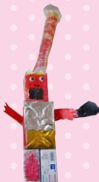
工作「おに、とびだせ」