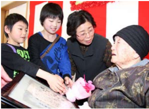
ひ孫2人からかわいらしい花束のプレゼント