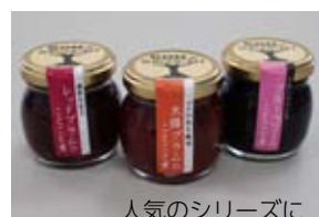
人気のシリーズに