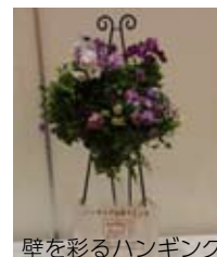
壁を彩るハンギング