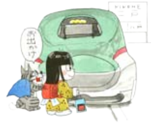
イラスト：きり光乗