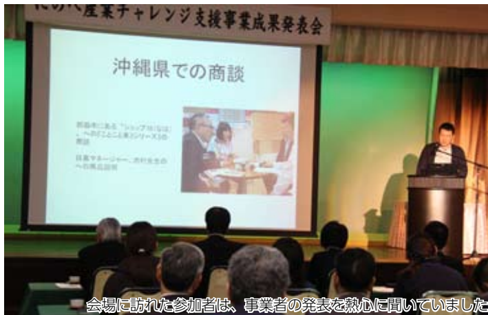
会場に訪れた参加者は、事業者の発表を熱心に聞いていました

市が、新たな事業の創出や特産品の開発などに取り組む事業を支援する「にのへ産業チャレンジ支援事業」の成果発表会は3月26日に行われ、10組がこれまでの成果を発表しました。にのへの産業活性化を目指し、個性あふれる視点で取り組んできた事業を紹介します。