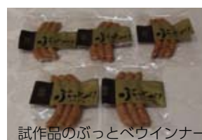
試作品のぶっとべウイナー