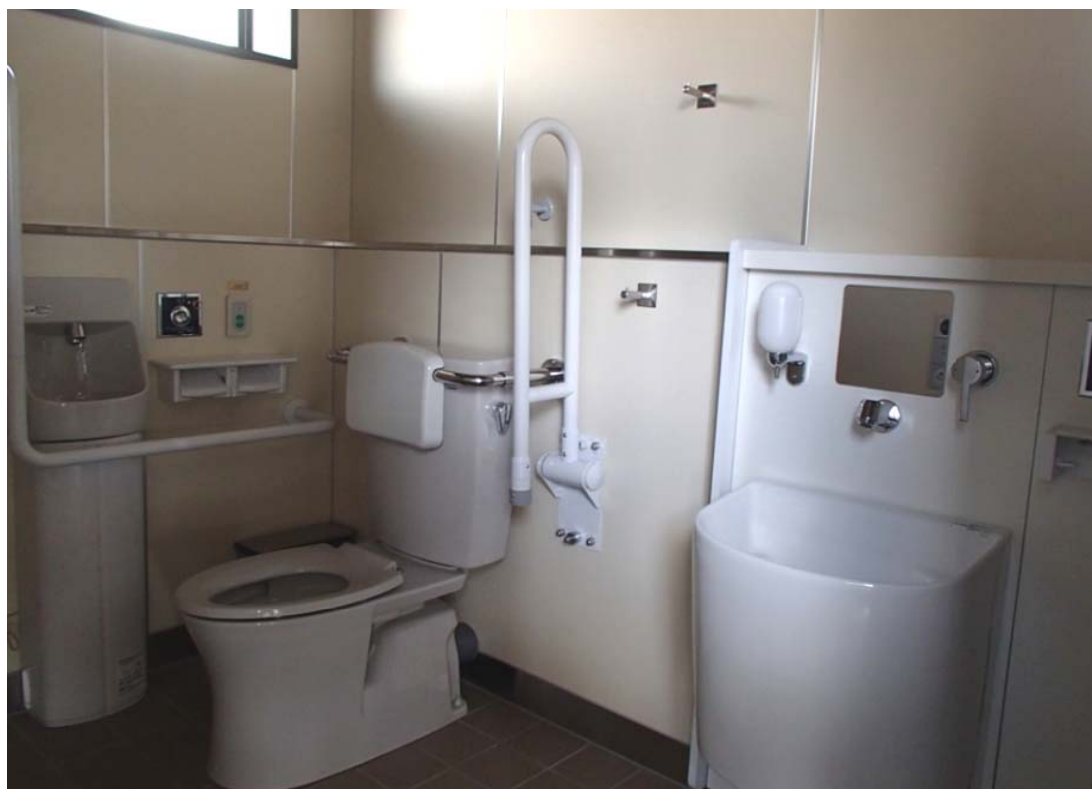
亀崎駅 多機能トイレ