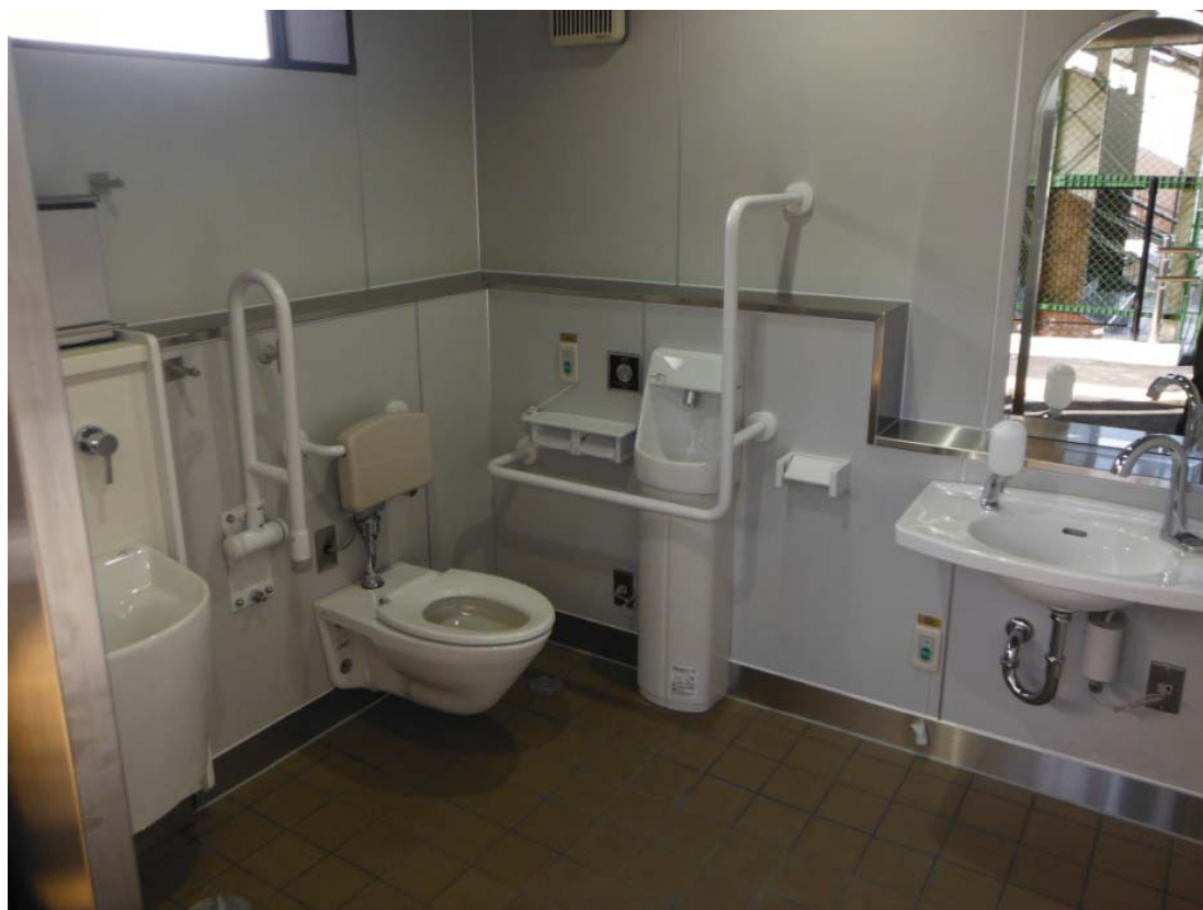
東浦駅 多機能トイレ