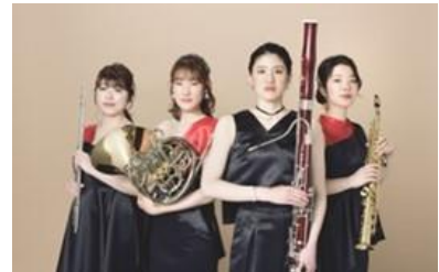
『クレモナ』モダンタンゴ・ラボラトリの皆さん