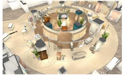
ラ・ノクタンビュール(イメージ)

昨年8月にオープンした「HANKYU BEAUTY(ビューティーサロン)」と、婦人肌着売場「メゾン・ド・ランジェリー」と併せて、ココロもカラダもリラックスしながら、美しいじぶんづくりを提案するワールドです。