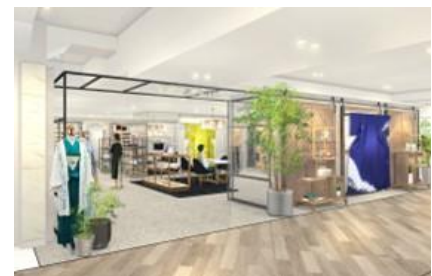
メゾン・ド・キモノ(イメージ)