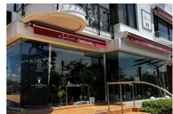
芦屋「アトリエカリノ」

☆本館4階「パティオステージⅣ」 週替わりで注目のブランドや旬のアイテムを期間限定で紹介するイベントスペースです。 オープニングには、阪神間で人気の芦屋の「アトリエカリノ」が出店します。