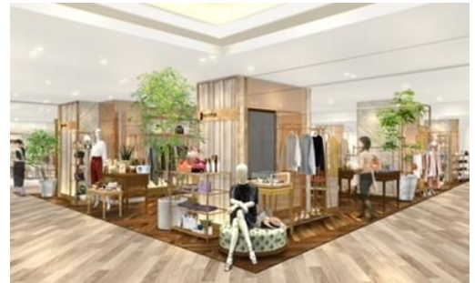
トゥールナーージュ(イメージ)

※「トゥールナーージュ」とは、撮影するという意味のフランス語。素敵なライフシーンにフォーカスするという意味も込めて名づけました。