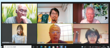
▲ZOOMで開催された子どもミライ会議。6名の参加者により建設的な意見交換ができました(会議の様子がYouTubeで視聴できます)。

気軽に子供を預けられる安心の場、相談できる場をテーマに対象年齢、活動内容、人員体制、保険適用、ネットワーク、外部支援、広報活動など討議を重ねています。今月中には青葉台小学校PTAへのアンケートを回収、ニーズを把握して今後の活動を見通す。活動の場としては、ふれあいサロンや商店街空き店舗の活用を視野にいれているとのこと。実現には、色々な課題はありますが、熱意が伝わってくる貴重な会議でした。今後の展開が非常に楽しみで、期待がもてます。(柳澤)