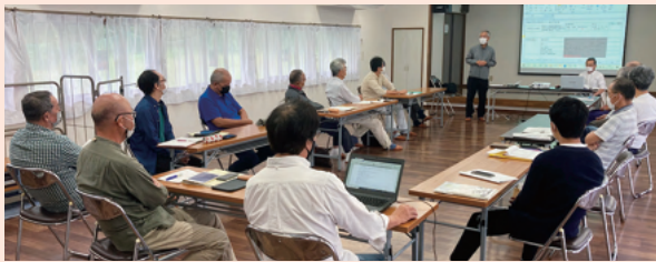
▲管理センター設立に向け、活発な意見交換が行われる準備委員会の様子。

現状の空家調査の結果、名義変更された所有者の方は、管理センターができれば利用したい意向が伺えました。しかし、所有者が亡くなってから名義変更された所有者の特定は難しく、現在住んでいるときに登録する空家バンク制になります。それも、高齢になり要介護や認知症発症などの状態になる前に登録いただく必要があり、家庭内でも話し合ってくださいとを訴求する集会を11月12日に行う予定です。町会役員対象のミニ集会、青小、東中の体育館を利用した大集会を行い、12月から事務所を開設、受付を開始する予定です。(藪木)