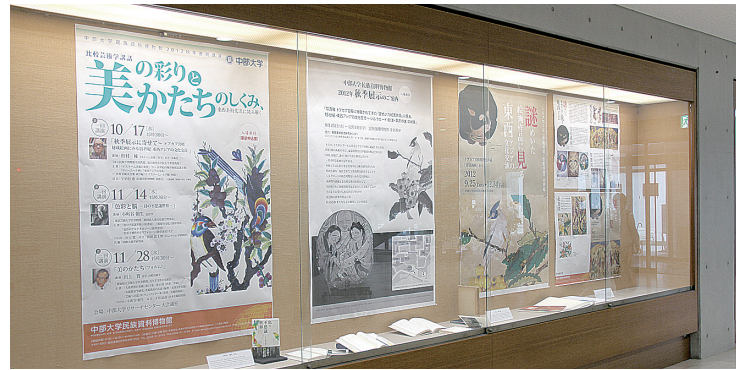
講師らの著作を1Fエントランスに展示