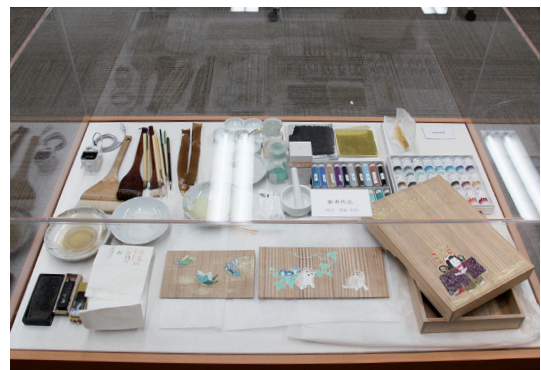
制作に用いた材料の一部紹介