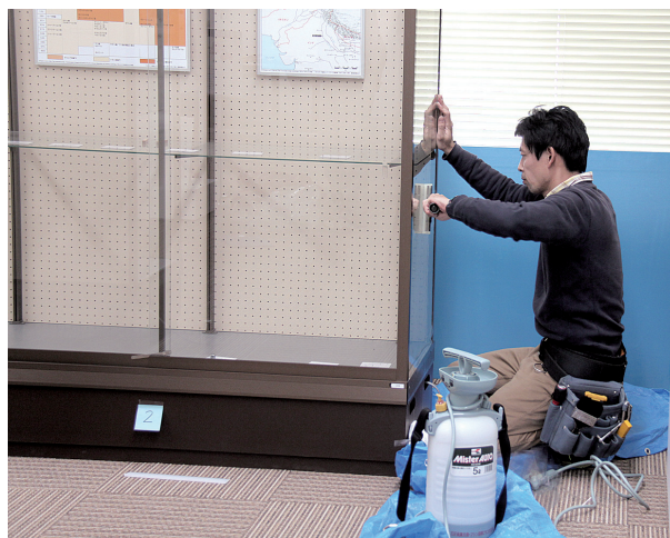
展示ケースフィルム工事の様子