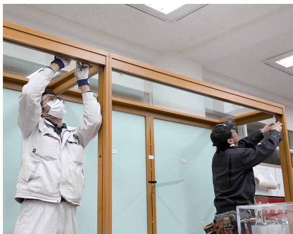
LED照明へへの入替工事の様子