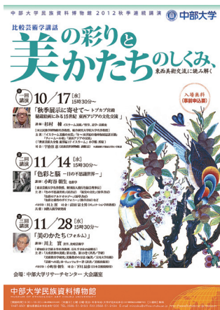
秋季連続講演チラシ